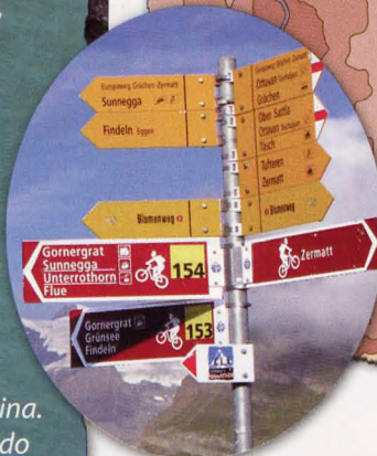
■ TMR bide seinaleak hesola metalikoetan

baina konponketa garrantzitsuena militarrek egindakoa da, Alpiniek edo mendiko tropek egindakoa hain zuzen ere. Bide honi " Sentiere della Libertà " deitzen diote. 1943 urtearen amaiera aldera alemaniarrek penintsula okupatu ostean, preso aliatu kopuru handi bat askatu zuten italiar partianoek eta bertako jendearen eta gerrillari antifaxisten laguntzaz negu gordinean bide hauetaz baliatu ziren askatasuna lortzeko. Batzuek ez zuten lortu eta bidean geratu ziren eta laguntzaile zenbait ere harrapatu eta exekutatu egin zituzten.