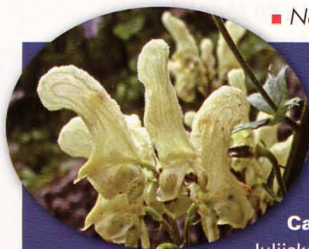
■ Navadna preobjeda ( Aconitum lycoctonum )

Según vamos girando hacia el este descubrimos las cumbres del macizo del Triglav y el Vodnikov Dom (1827 m, 2,30 h). La gente que sube y que baja de la cima más alta del país inunda los alrededores del refugio. Desde él, con el Triglav siempre a la vista, la senda se empina y rodea el macizo de Vernar. Hay un par de tramos con escalones tallados y un cable de apoyo. Así se llega al Konjsko sedlo (2020 m, 3h). Aquí se puede elegir subir al Dom Planika (2401 m, 4 h) o al Triglavski Dom (2515 m, 4,30 h). Desde cualquiera de ellos se encara el cresterío final del Triglav. □