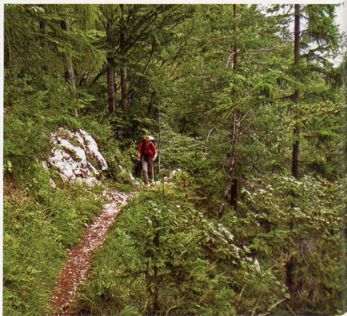
■ Bosque de Pogorisce, en la subida al Vrtasko Sleme

La bajada la realizamos por la misma ruta, mientras una lluvia refrescante cae sobre nuestras cabezas y mochilas.