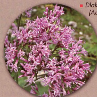
■ Dlakavi lepa (Adenostyles alliariae)

L A gente de Eslovenia siente una asombrosa devoción por sus montañas. Forman parte esencial de un pequeño territorio al que está profundamente ligada y en el que ha mantenido sus costumbres y su lengua, incluso mientras formaba parte de grandes imperios y estados europeos. De una población de dos millones de personas, más de ochenta mil pertenecen a la federación alpina eslovena. Esta pasión se palpa singularmente en el Triglav, la cumbre más alta del país, donde hombres y mujeres de todas las edades se esfuerzan en trepar su aéreo cresterío para tocar la torreta que corona la cima al menos una vez en la vida.