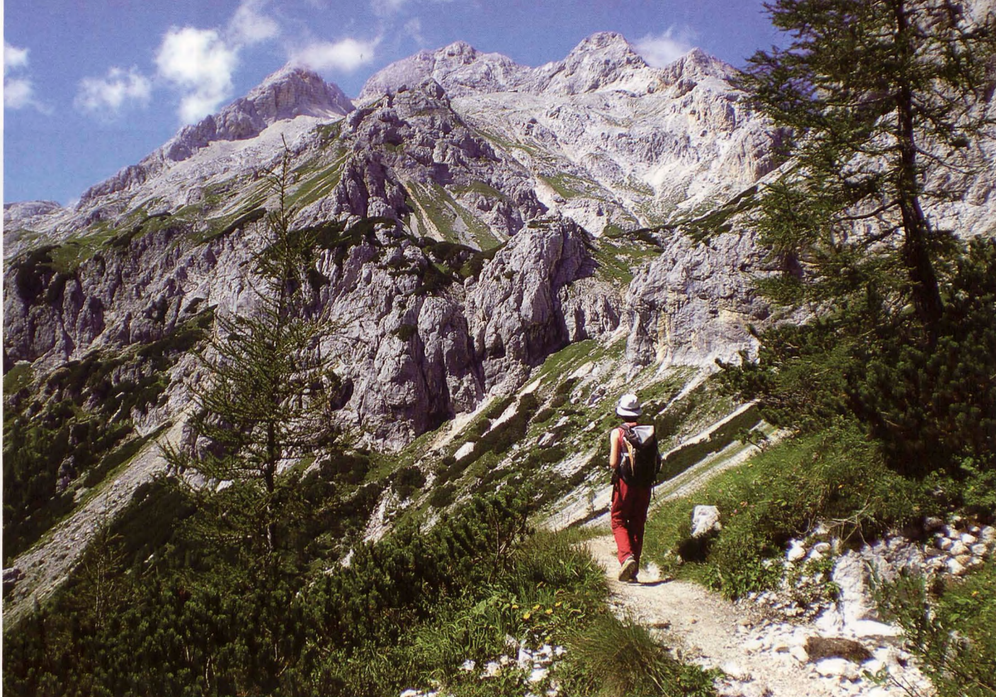
■ Camino del Triglav por la cara sur

Retrocedemos por la ruta de subida hasta la explanada del telecabina (1.15 h), donde nos unimos a la hilera de visitantes que salen disparados de las cabinas en dirección a la ventana del Prestreljnik, un agujero que la leyenda atribuye al diablo. La senda sale en dirección NW, asciende por la pedrera y, en la desviación al Visoki Kanin, gira hacia el NE, por debajo del cresterío del Prestreljnik, alcanzando la ventana (1.45 h).