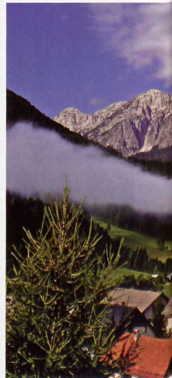
■ Koca na Triglavski jezerih, bajo el Veliko Spicje

herbosa, donde unas ovejas pastan inocentemente al lado de restos de alambradas oxidadas, para llegar a la cima (2244 m, 4.15 h). Desde este balcón se ve el Prisanc, Razor, Gamsovec y Triglav. Bajamos por la misma ruta (7.15 h).