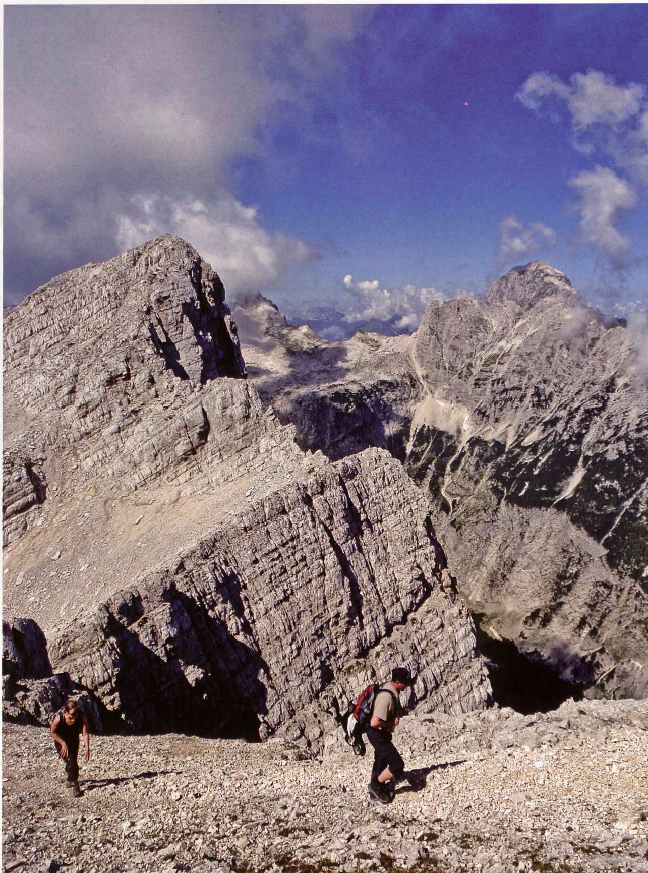
■ Velika Mojstrovka y Mangart desde Mala Mojstrovka

cimas que sobresalen sobre el valle de Tamar: Jalovec y Mangart. Al este, la mole inconfundible del cercano Prisank, seguido del cresterío del Skrlatica y la pirámide del Spik, destacando en el macizo de Godz Martuljek.