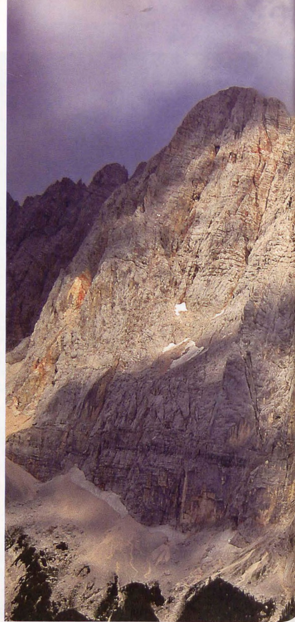
■ Las cumbres del macizo Skrlatica