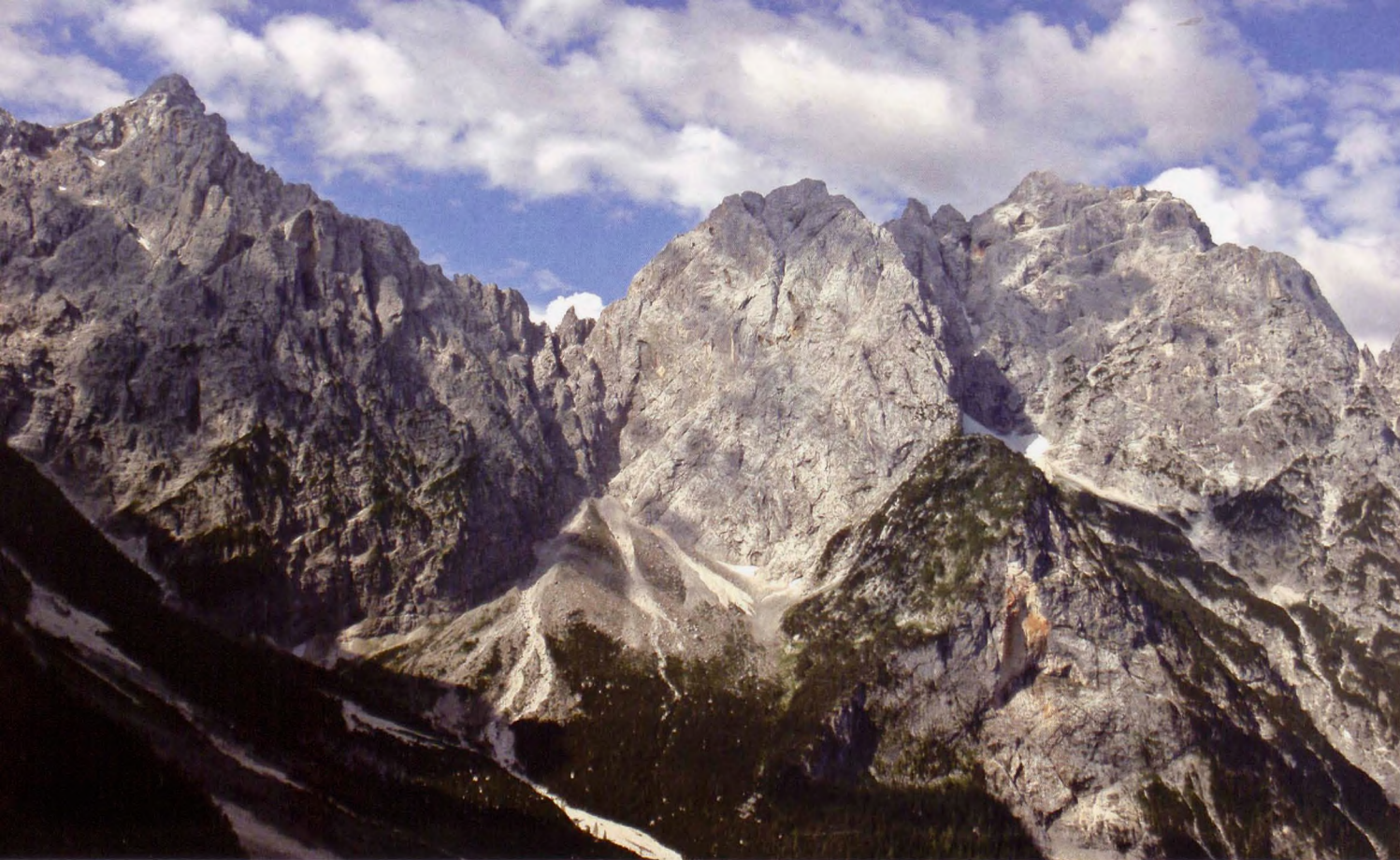
■ Razor y Prisank, desde Gruntovnica