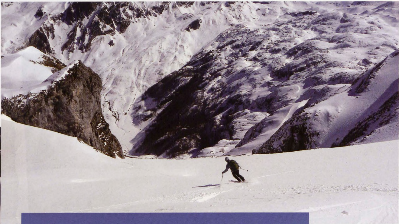
■ Descendiendo sobre Lhers