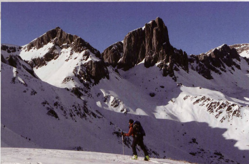
■ Las Agujas de Ansabère