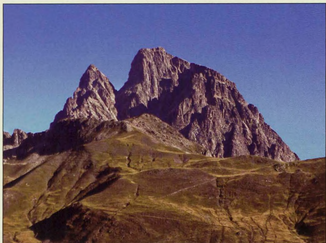
■ Midi d'Ossau, del Portalet

7 Ossau: La más deseada cima del Pirineo occidental, el Pic du Midi d'Ossau, emerge sin rival por encima de los valles de Bious al oeste y de Brousset al este. No importa desde donde se observe; su singular figura atrae irremediablemente. Su ascensión por la vía normal implica salvar tres chimeneas que le añaden interés. Aunque no suponga una dificultad extrema (PD), conviene llevar cuerda y casco por la caída de piedras. El resto de vías están reservadas a los escaladores.