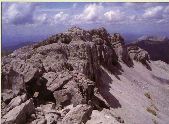
■ Cresterío de Peñaforca

2 Larra-Roncal: Por su mayor altura y esbelta silueta, el Auñamendi o Pic d'Anie se impone sobre Hiru Erregeen mahaia. Dicha montaña tiene importancia orográfica, religiosa e histórica. En Pierre San Martín, base de su ascensión, se celebra desde el 13 de julio de 1375 el tributo de las tres vacas, que representa el acuerdo alcanzado entre los habitantes de los valles de Baretous y Roncal para poner fin a la disputa que mantenían por el uso de los pastos altos para el ganado.