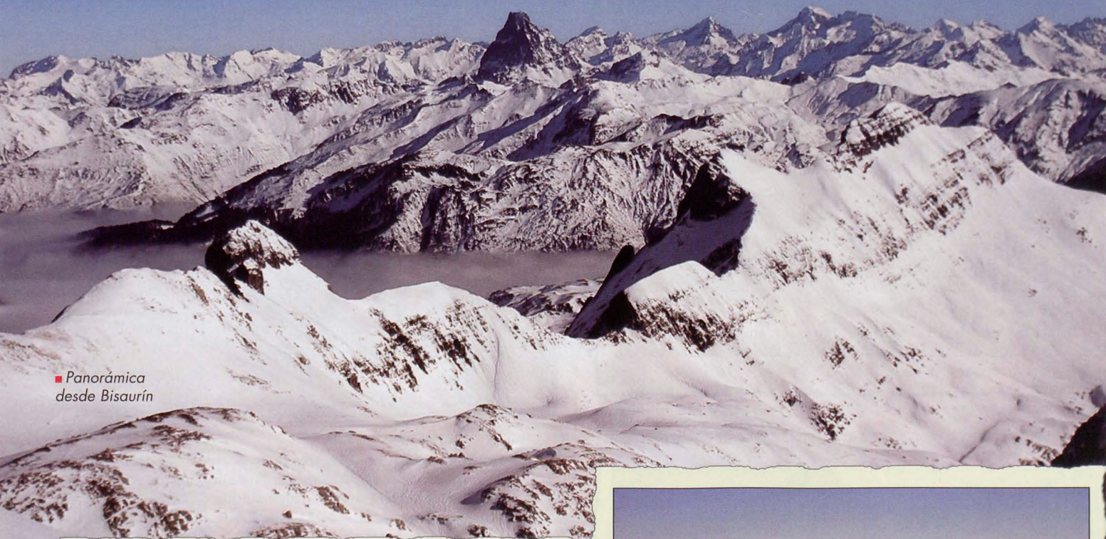
■ Panorámica desde Bisaurín