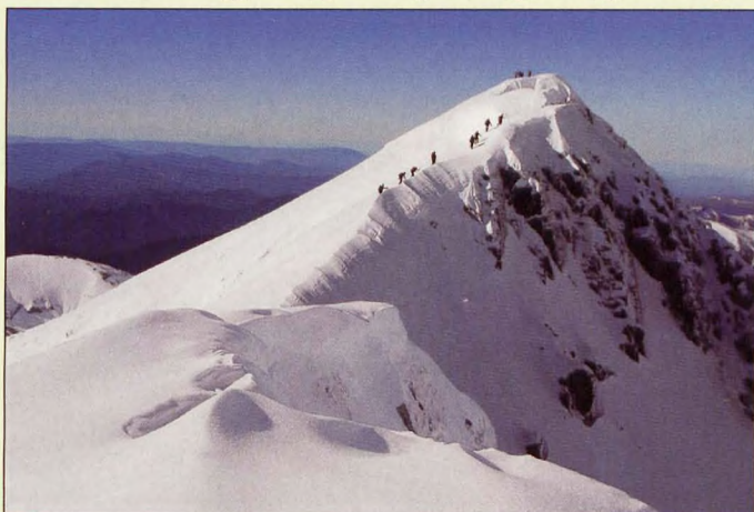
■ Arista cimera del Bisaurín

3 Ansó-Zuriza: Escondida tras la espectacular muralla de los Alanos, Peñaforca es el punto culminante de esta sierra. Desde la Selva de Oza muestra toda su grandeza.