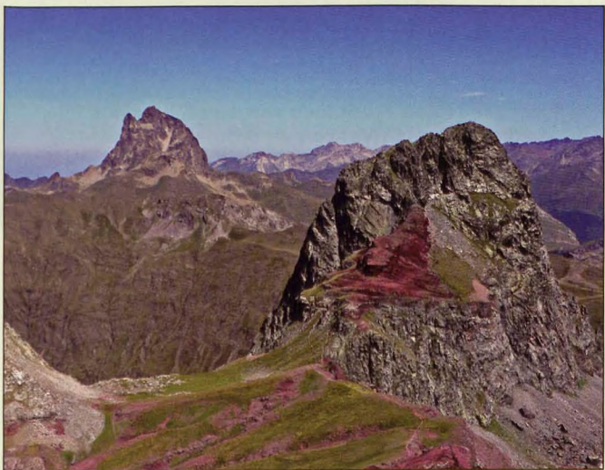
■ Midi d'Ossau y Anayet, del Vértice de Anayet

7 Ossau: La más deseada cima del Pirineo occidental, el Pic du Midi d'Ossau, emerge sin rival por encima de los valles de Bious al oeste y de Brousset al este. No importa desde donde se observe; su singular figura atrae irremediablemente. Su ascensión por la vía normal implica salvar tres chimeneas que le añaden interés. Aunque no suponga una dificultad extrema (PD), conviene llevar cuerda y casco por la caída de piedras. El resto de vías están reservadas a los escaladores.