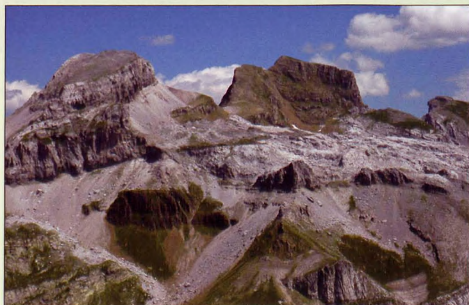
■ Cara sur de Llana de la Garganta y Aspe

5 Aspe: Entre el macizo de Bisaurín y Canfranc destaca el Pico de Aspe, de aspecto geométrico y caras verticales. Se asoma por encima de las pistas de Candanchu más de un millar de metros.