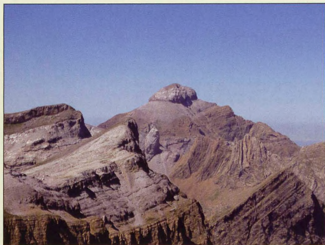
■ Collarada, desde Telera

9 Collarada/Ip: Collarada es la mayor elevación del circo de Ip. Presenta un importante desnivel que le ha dado fama de ascensión larga y dura. La pista de Trapa ha recortado notablemente la subida, aunque no hay que olvidar que esta pista tiene acceso restringido.