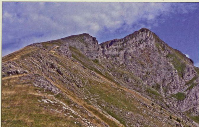
■ Cresta SSE del Ori, ruta normal

1 Selva de Irati: Ori/Orhi, el primer dosmil del Pirineo. Se encuentra en plena divisoria de aguas cantábrico-mediterránea.