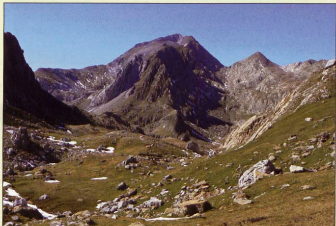
■ Bisaurín, del Puerto de Bernera

4 Hecho-Puerto de Somport: La mole del Bisaurín domina con 1700 metros de desnivel el valle de Hecho al oeste y desde 1500 metros el de Aragüés al sur. Es la primera cumbre que pasa de los 2600 metros viniendo del oeste.