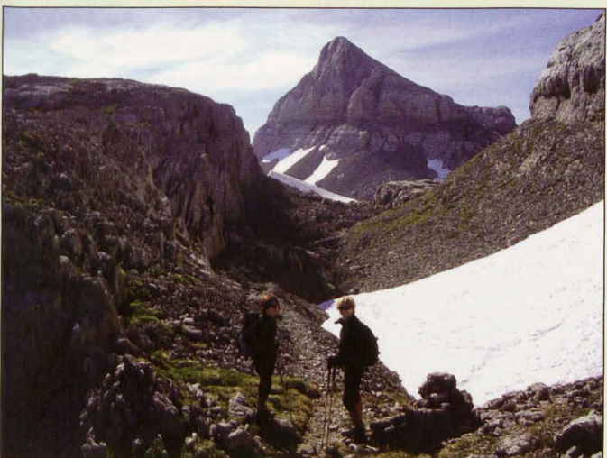
■ Camino del Pic d'Anie

1 Selva de Irati: Ori/Orhi, el primer dosmil del Pirineo. Se encuentra en plena divisoria de aguas cantábrico-mediterránea.