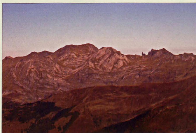
■ L'Escarpu/Pic de Sesques, desde Llana del Bozo

5 Aspe: Entre el macizo de Bisaurín y Canfranc destaca el Pico de Aspe, de aspecto geométrico y caras verticales. Se asoma por encima de las pistas de Candanchu más de un millar de metros.