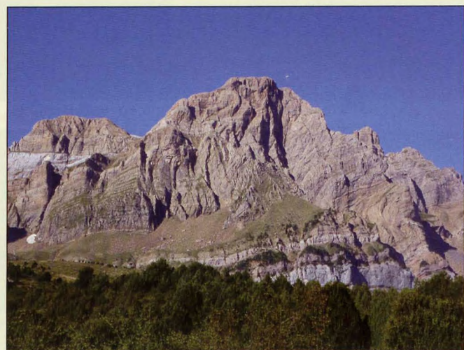
■ Murallón de Telera

9 Collarada/Ip: Collarada es la mayor elevación del circo de Ip. Presenta un importante desnivel que le ha dado fama de ascensión larga y dura. La pista de Trapa ha recortado notablemente la subida, aunque no hay que olvidar que esta pista tiene acceso restringido.