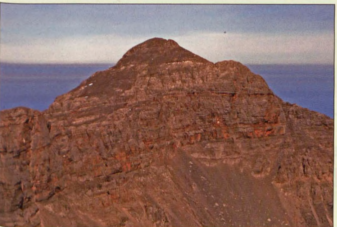
■ El Pic d'Anie, desde Hiru Erregeen Mah

2 Larra-Roncal: Por su mayor altura y esbelta silueta, el Auñamendi o Pic d'Anie se impone sobre Hiru Erregeen mahaia. Dicha montaña tiene importancia orográfica, religiosa e histórica. En Pierre San Martín, base de su ascensión, se celebra desde el 13 de julio de 1375 el tributo de las tres vacas, que representa el acuerdo alcanzado entre los habitantes de los valles de Baretous y Roncal para poner fin a la disputa que mantenían por el uso de los pastos altos para el ganado.