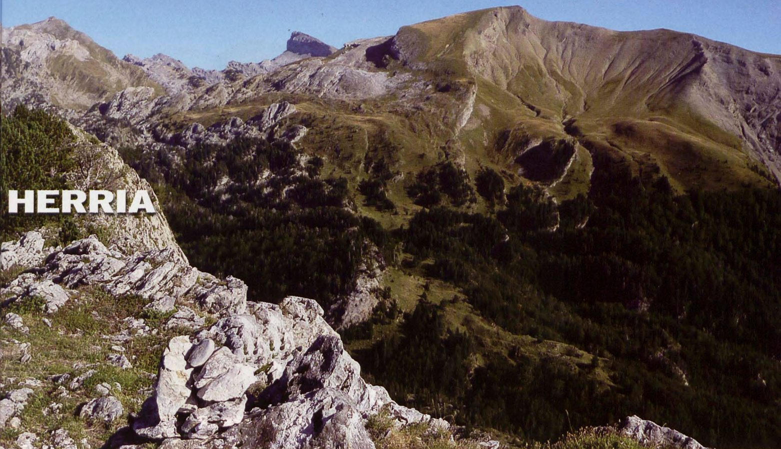
■ Panorámica Auñamendi-Lapakiza desde Lapazarra

rior encontramos también rododendros, brezos, arándanos y gayubas, así como algunos rasos y pastizales de altura.