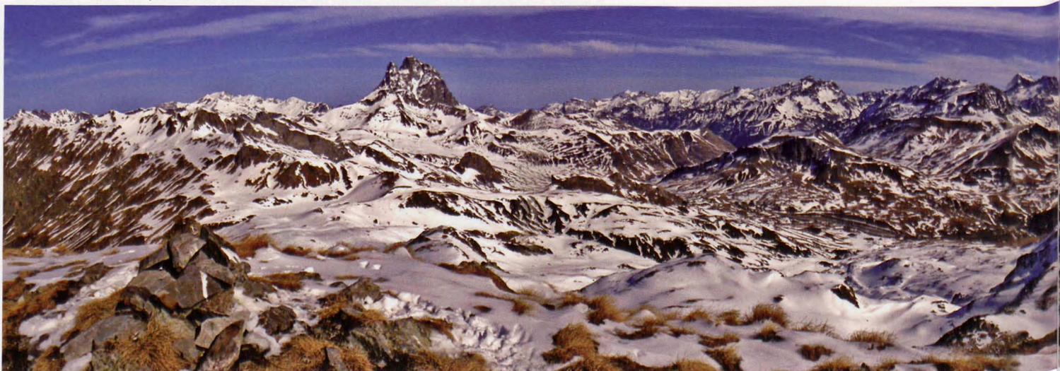
■ Panorama desde Espelunciecha

Desde el Anie hasta el collado de Somport, la cordillera pirenaica se curva para trazar un amplio arco plagado de cumbres que superan los dos mil metros. El Pic Labigouer se sitúa separado y al norte de esta onda, en el valle francés de Aspe, por encima de los prados de Lhers. Una posición privilegiada para contemplar las principales cumbres del Pirineo Occi-