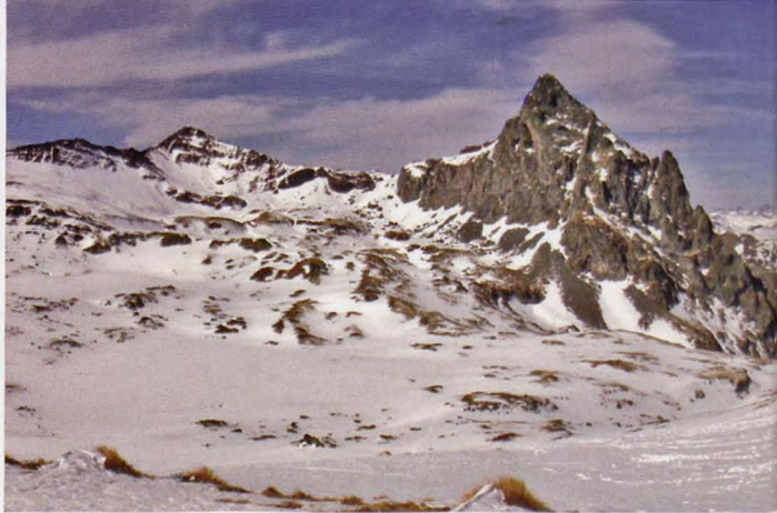
■ Vértice de Anayet, Anayet y Espelunciecha

dental y adivinar los pasos transpirenaicos por los que han cruzado maquis, contrabandistas y pastores.