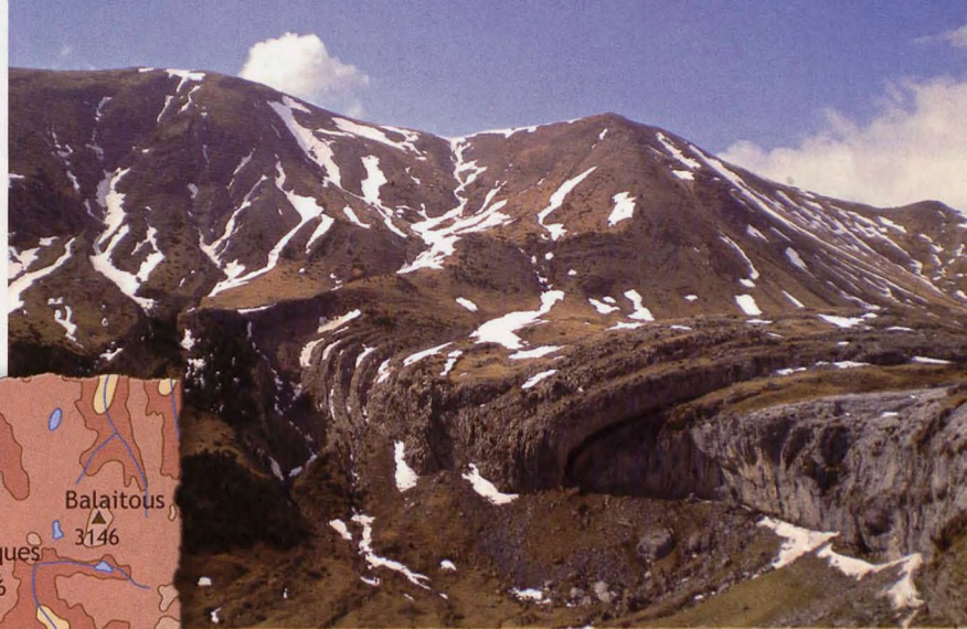
■ Sierra de la Estiva