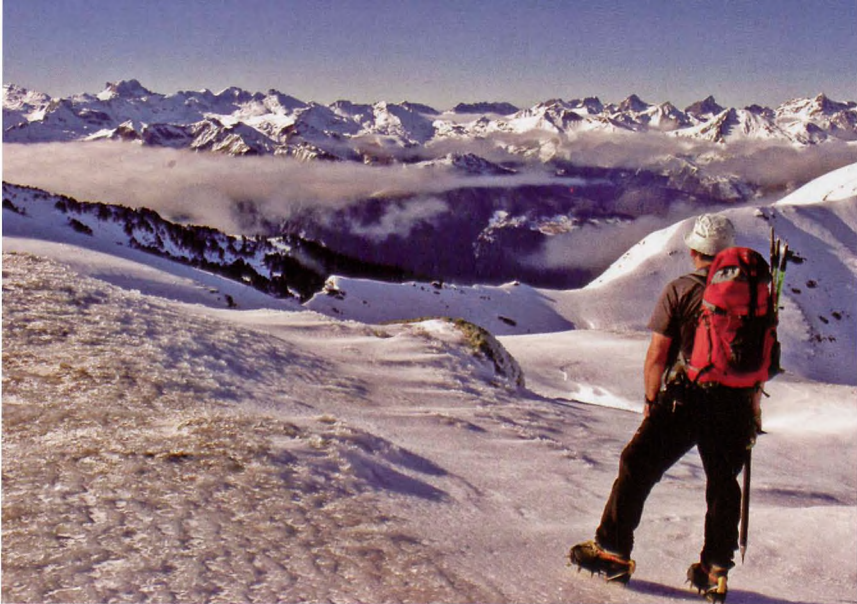
■ En el Col d'Ayous

dores (1650 m, 0.5 h), se sigue el camino señalizado con las marcas rojas y blancas. Ladeando se cruzan los arroyos que bajan de las estribaciones del Aspe, hasta situarnos en el barranco de Lecherines. Se salva la corriente de agua y, al otro lado, se va superando la pendiente en lazadas, en dirección al Collado de la Madalena o Torbillón, que corta el macizo montañoso de Lecherines. El collado (2055 m, 2 h) está atravesado por la pista que va de Borau al refugio de López Huici (SE). Este largo camino carretil (18 km) discurre próximo al cordal y podría ser una buena vía de acceso a las cumbres. Sin embargo, es una ruta ornitológica y en época de ocupación por las aves su acceso está restringido y controlado por el Ayuntamiento de Borau. Se abandona el sendero GR11 y ascendemos (S) por la loma helada hasta una anticima que precede a la Punta de la Madalena (2270 m, 2.20 h). El Pico de la Madalena puede alcanzarse en un cuarto de hora más.