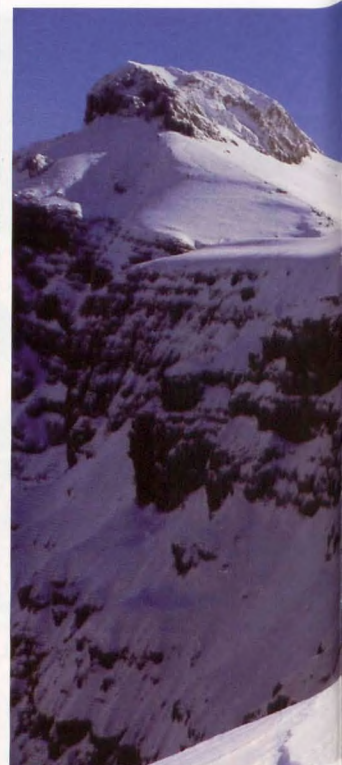
■ Subiendo a Collarada

saurín y las sierras secundarias de La Estiva y Gabás. En este sector se han incorporado cimas que no figuraban en trabajos anteriores, como el Sommet des Cauderès (2039 m), cercana al pico Lariste (2168 m), o Les Tourelles (2017 m), en el extremo NW del Pic Bacqué (2094 m). También se añade la Aiguille de l'Acherito (2101 m) que, aunque citada [7] con una traducción prácticamente literal [2], en realidad se describe una cota menor, contigua a la brecha de Hannas, no la cima de la verdadera aguja. En la zona de Arlet se ha recuperado una cumbre con el nombre de Pic du Lac d'Arlet (2175 m) que sí se relata en las ediciones antiguas [7].