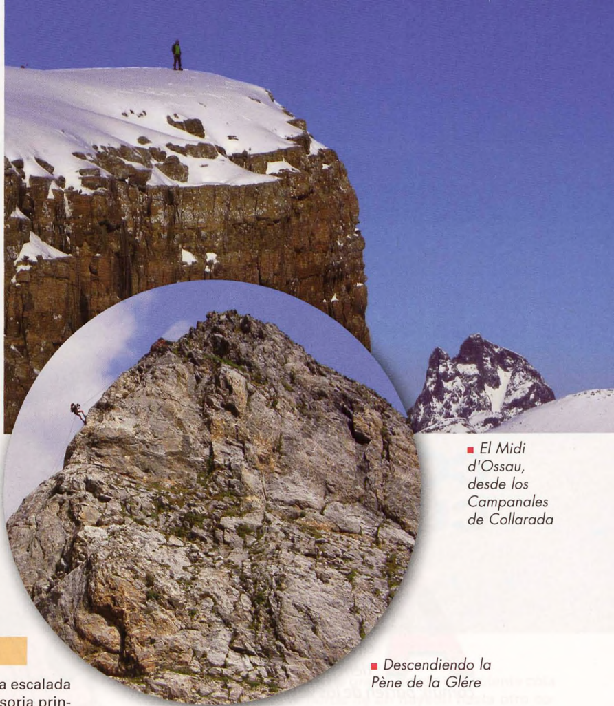
■ El Midi d'Ossau, desde los Campanales de Collarada