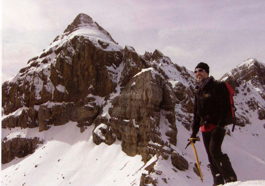
■ Punta Escarra