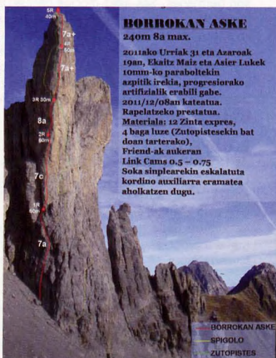
■ La Petite Aiguille de Ansabere cuenta con una nueva propuesta