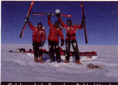
FOTO DE LA EXPEDICIÓN