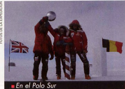
■ En el Polo Sur