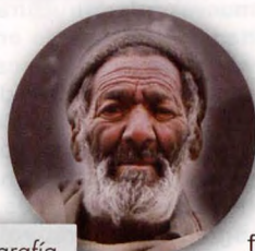
■ Fotografía de un habitante del valle de Hushé