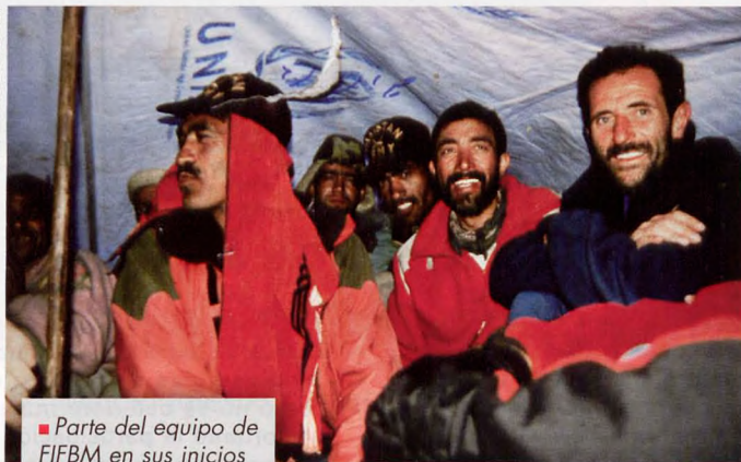
■ Parte del equipo de FIFBM en sus inicios