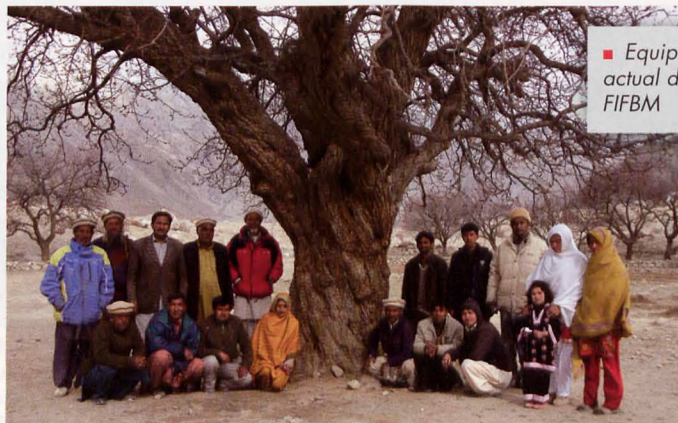
■ Equipo actual de FIFBM