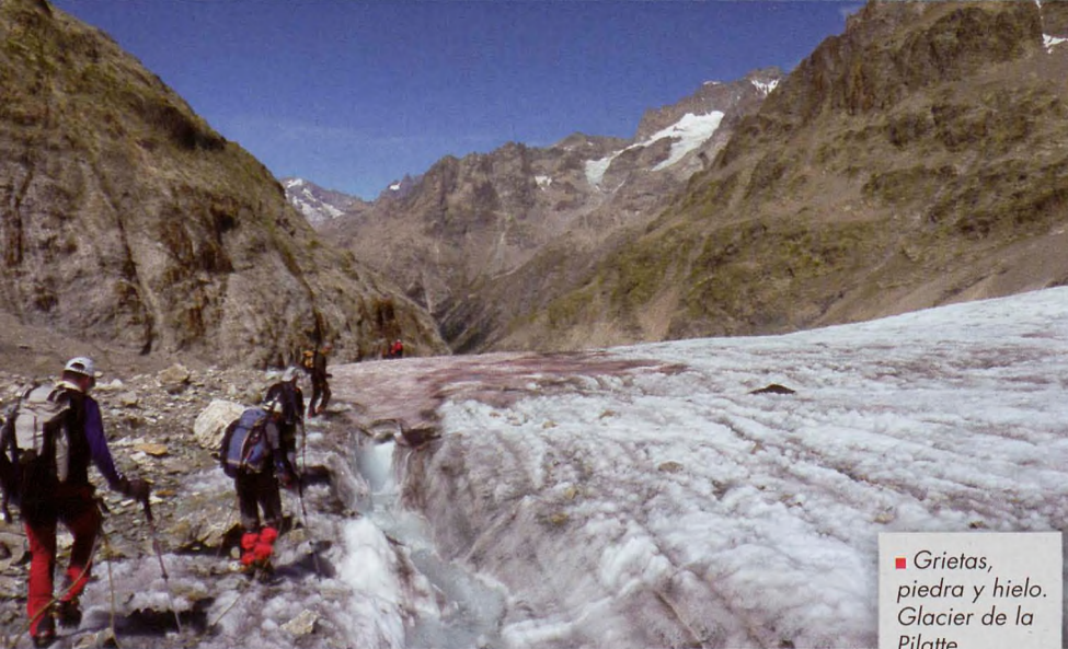
■ Grietas, piedra y hielo. Glacier de la Pilatte