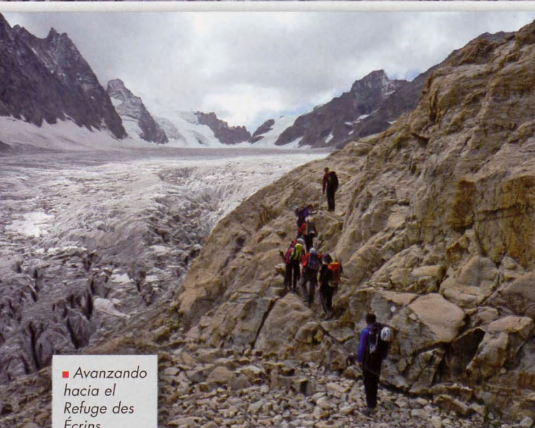
■ Avanzando hacia el Refuge des Écrins