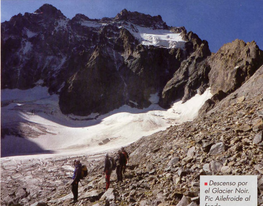
■ Descenso por el Glacier Noir. Pic Ailefroide al fondo