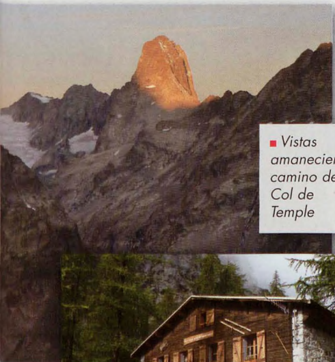
■ Vistas amaneciendo camino del Col de Temple