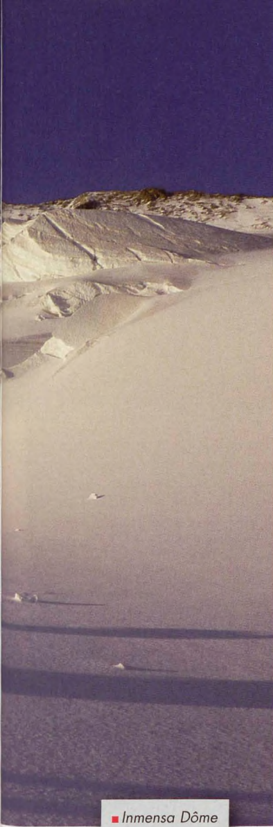
■ Inmensa Dôme de Neige