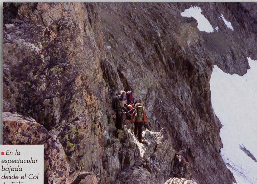
■ En la espectacular bajada desde el Col de Sélé

A las 10 h nos ponemos todos en marcha. ¡Vaya horario montaño! Nada más pasar las cuatro casas de la aldea, se toma hacia la izquierda una pista y después un sendero que va ganando altura entre bosques, paralelo a un arroyo de deshielo del Glacier du Sélé, por el que ascenderemos al día siguiente. Hay que atravesar una pequeña ferrata sin problemas y, tras