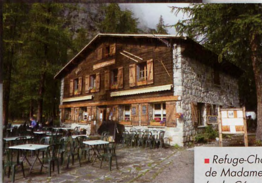
■ Refuge-Chalet Pré de Madame Carle (o de Cézanne)

Descendemos hasta el Glacier Noir por una ferrata y encordados. Otra vez la roca, esa roca que tanto me gusta agarrar, sentir que me pego a ella con solo tocarla. Llegamos al glaciar a las 10 h. Este glaciar es duro, pero no nos ponemos los crampones ni nos encordamos para descenderlo y avanzamos lentamente entre hielo y roca. ¡Da pena ver cómo están los glaciares! Los últimos 600 m de la bajada se hacen por el borde de la morrena. Nos cuesta cuatro horas llegar hasta el Refuge Pré de Madame Carle o Cézanne, situado a 1874 m, donde comemos una ensalada monumental.