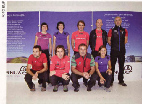
■ Mendi Lasterketen Euskal Selektzioa