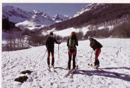
■ Esquí de montaña