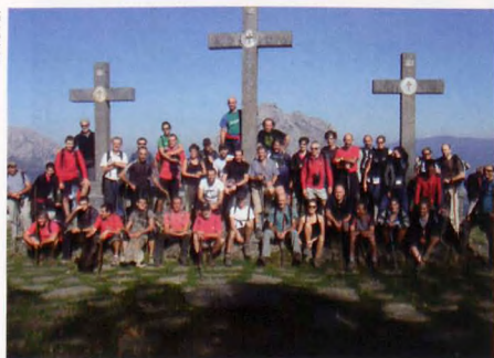
■ Mendi Martxa FBF