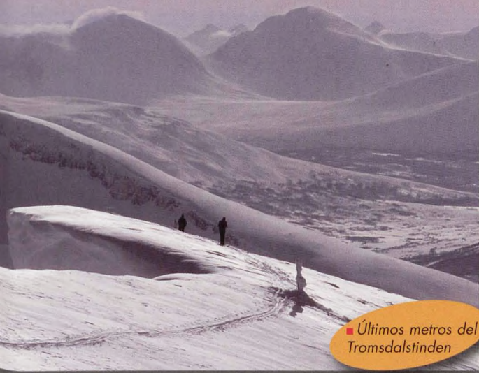
■ Últimos metros del Tromsdalstinden

pendiente sobre un auténtico polvazo. Llegamos así a la cumbre del Middgastinden, pena de visibilidad. Frente a nosotros tenemos un descenso disfrutón, una auténtica pena que lo tengamos que hacer sin ver el relieve. Bajamos hasta el lago más grande. Bajo una intensa nevada volvemos a colocar las pieles y ascendemos una cima secundaria (525 m), desde donde tenemos un descenso directo hasta el vehículo.