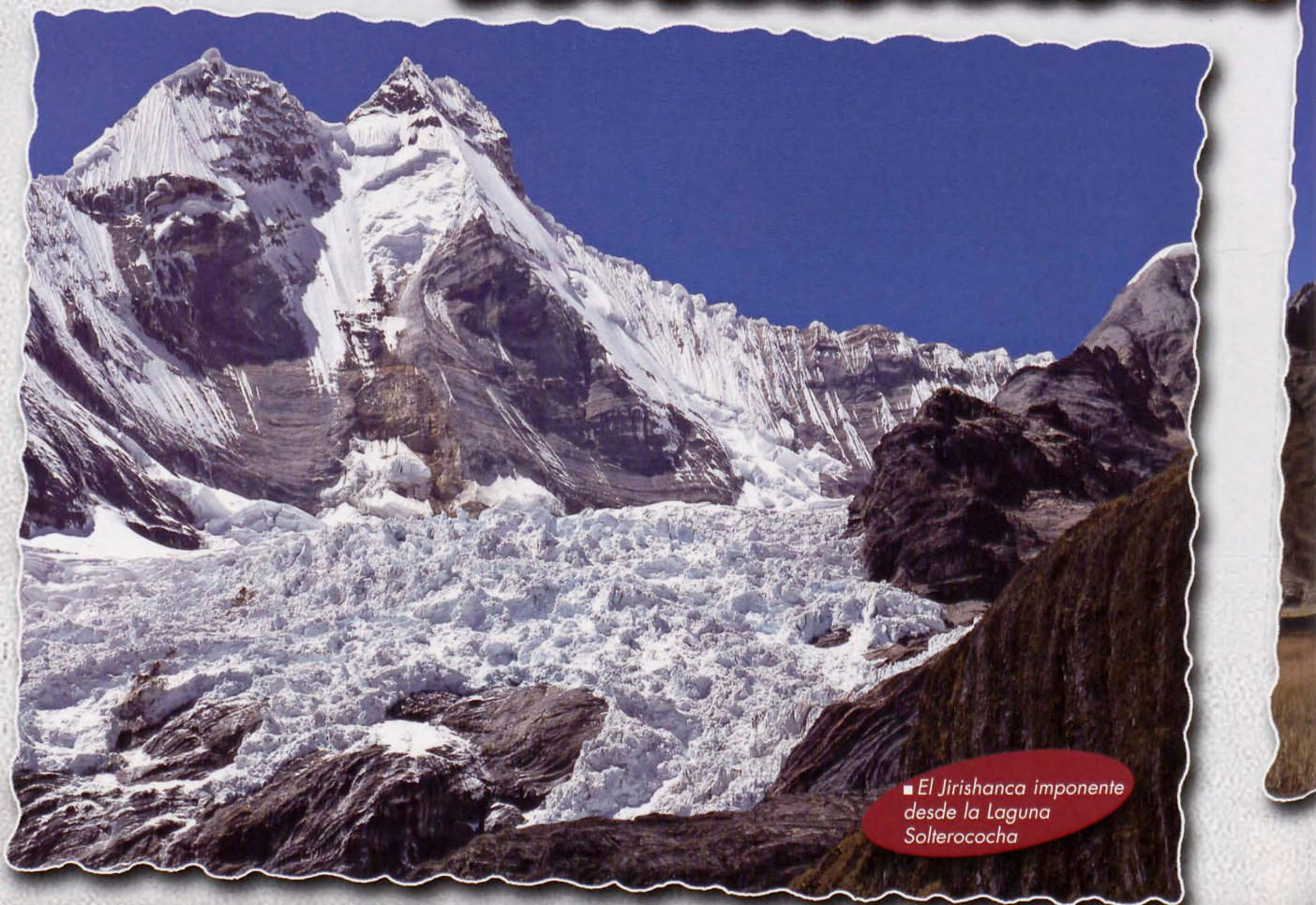
■ El Jirishanca imponente desde la Laguna Solterococha