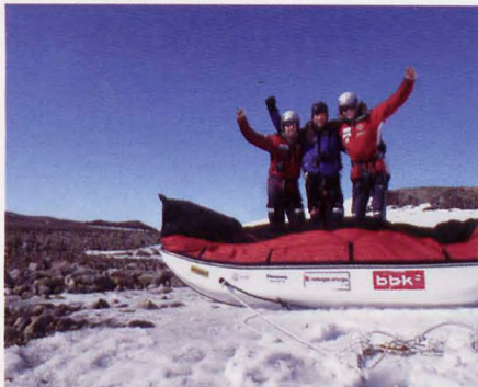
■ Los tres componentes al concluir la travesía