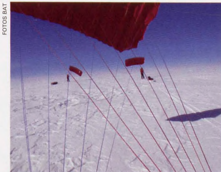
■ Un momento de la travesía

La expedición NATURGAS / BBK TRANSANTARTIKA 2011 salió el 11 de mayo de Narsaq. Iban a ser cuarenta días, pero lo han conseguido en 32, en total autonomía, con esquís y cometas, tirando de sendos trineos donde llevaban todo el material necesario. Han soportado temperaturas extremas por debajo de -30 grados, vuelcos de trineo, tormentas que no les permitían salir de la tienda en 24 horas, algunos días sin una brizna de viento que les han obligado a arrastrar los trineos de 100 kilos a golpe de músculo y fuerza mental... Y así, 32 jornadas de 10 y 11 larguísimas horas sin parar para demostrar que todavía hay aventura en los rincones más inhóspitos del planeta y una cordada de tres alpinistas con ilusión y valor para afrontarlas.