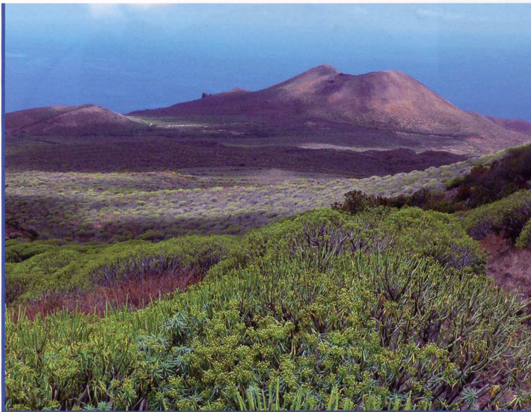
● Tabaibas y volcan de Orchilla