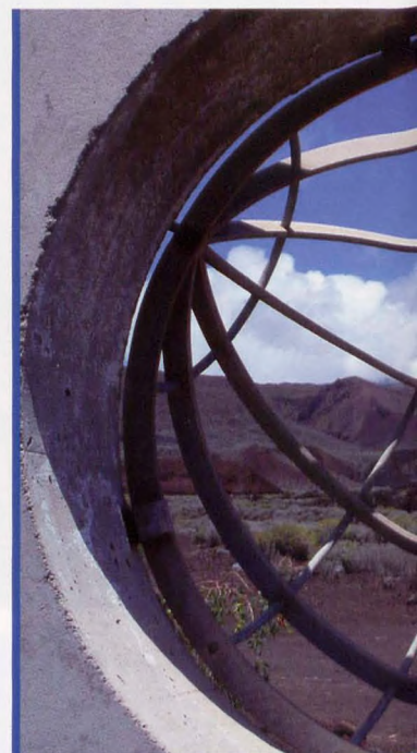
● Monumento al Meridiano 0