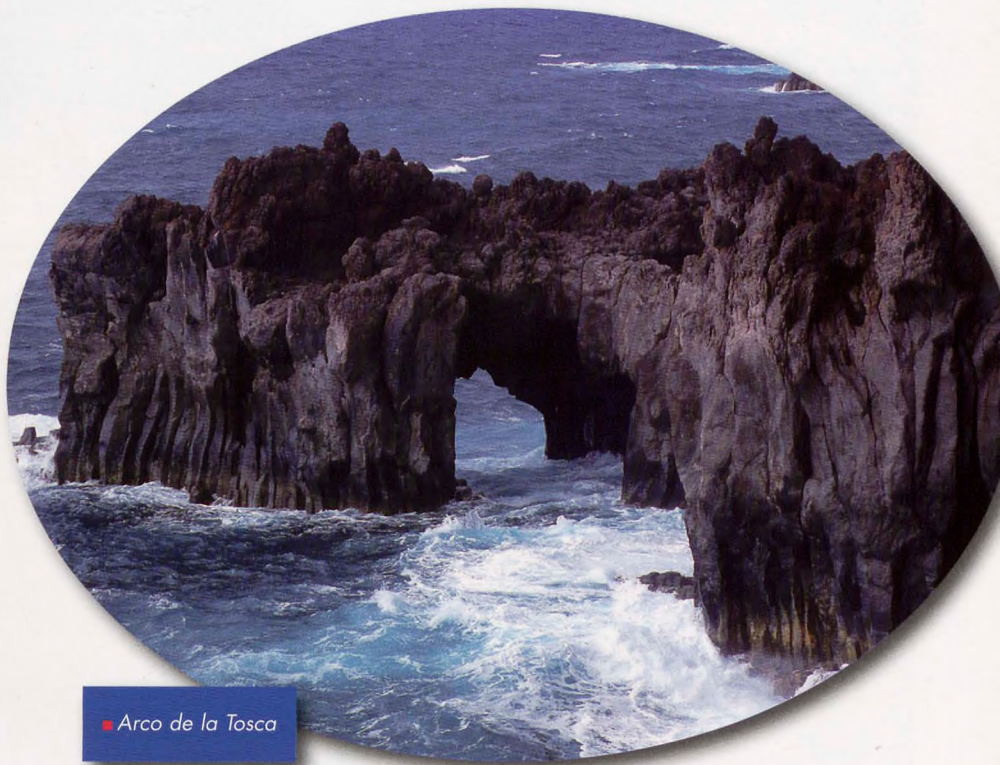
■ Arco de la Tosca