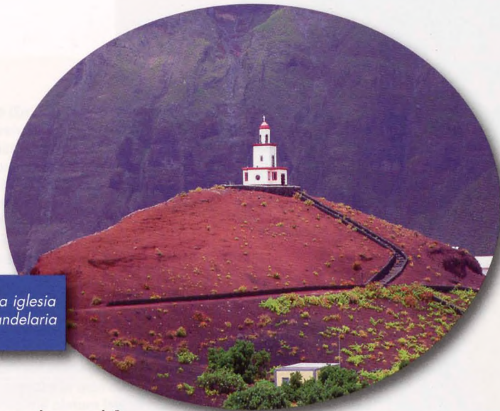
• Torre de la iglesia N.S. de Candelaria