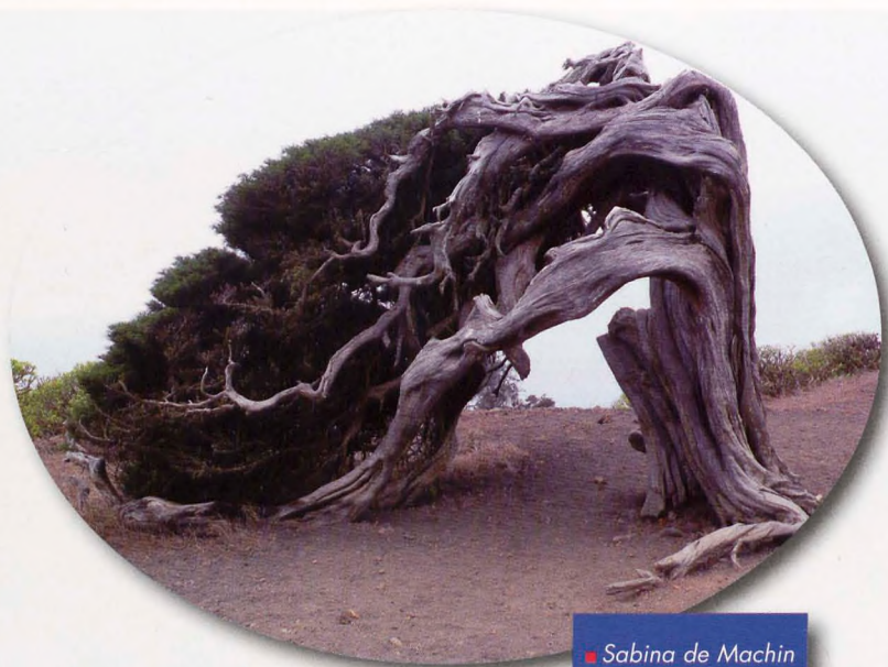
■ Sabina de Machin