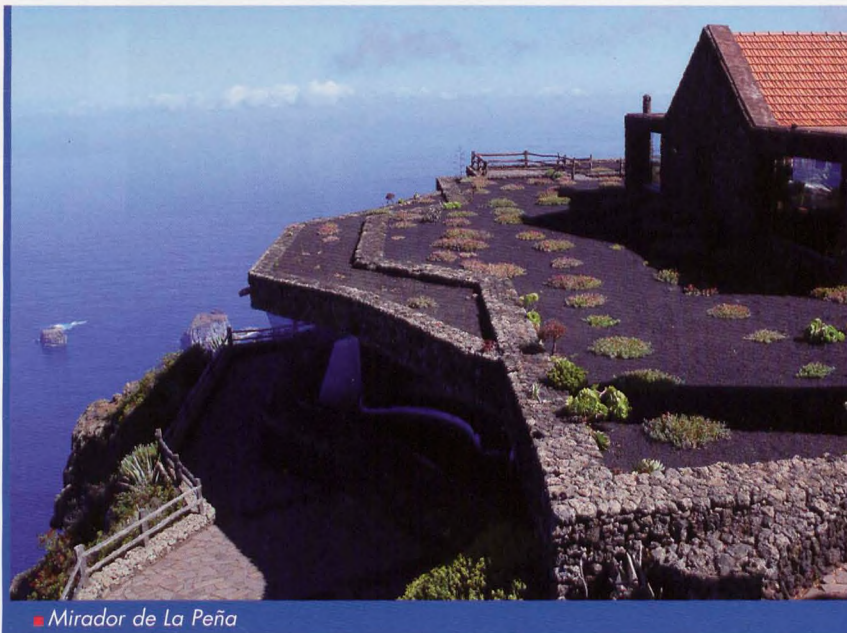
■ Mirador de La Peña

14,45 h. Retomamos el camino salpicado de pinos y brezos, al poco rato se nos une el PR H1, que va de El Pinar a Sabinosa. Tras 15 minutos el PR gira a la derecha dirección Sabinosa, pueblo enclavado en el extremo oeste de El Golfo. En 45 minutos de descenso pasamos junto a la Raya de Binto y poco más adelante la fuente del mismo nombre, que apenas aporta humedad. Seguimos nuestro descenso, dejando a la derecha una cumbre con antena, se trata de Montaña de los Humilladeros de 1284 m.