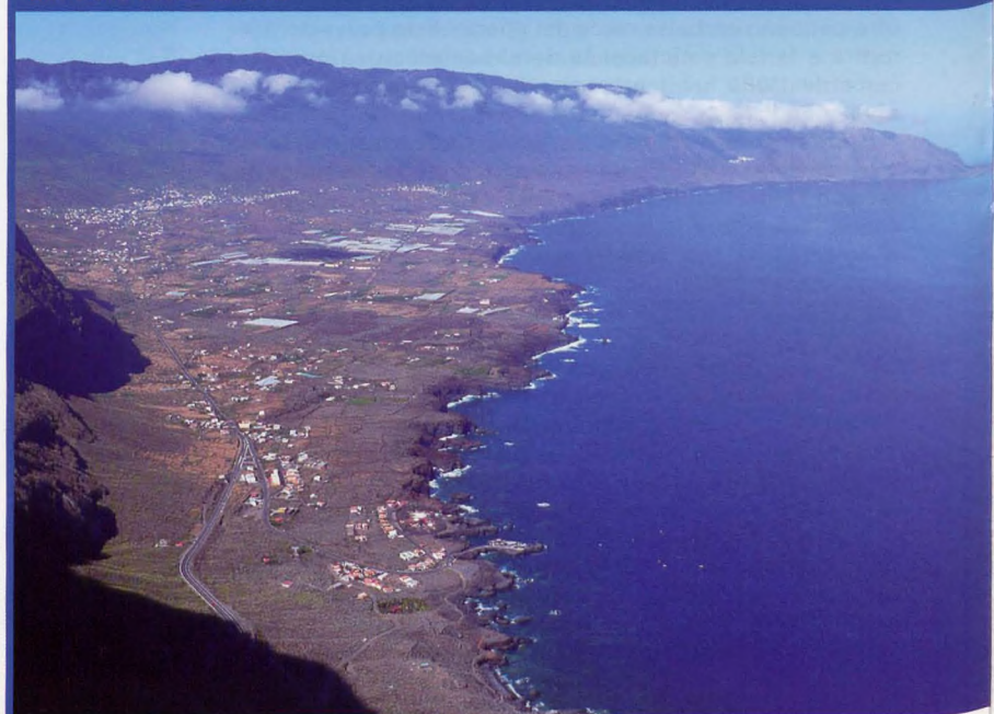
• El Golfo desde La Peña

Ya sólo nos separan dos km del punto más alto de El Hierro, por fortuna las nubes han empezado a disiparse. Durante esta última parte del camino nos acompaña una planta desconocida en las otras islas. Es abundante tiene buen porte y está en flor, se trata de "el aginajo", un tipo de tajinaste endémico de El Hierro, muy visitado por las abejas para la elaboración de miel. Remontamos las cuestas finales y cumbreado accedemos al pico Malpaso 1500 m, techo de la isla. En la cumbre antenas de comunicaciones, placas solares, cartel de madera, vértice geodésico, plancha de hierro con una paloma (o algo así) grabada y un mojón conmemorativo de la unión de esta GR con la ruta europea E7. Vista soberbia sobre El Golfo cuando se abren las nubes.