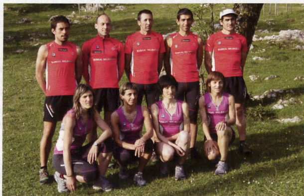
■ Selección de Carreras por Montaña