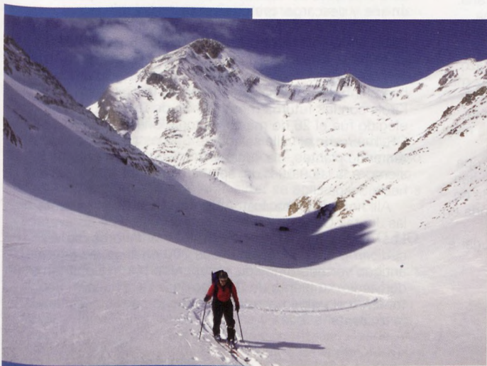
■ Travesía de esquí

Como reflexión final tengo muy claro y es muy evidente que en la montaña hay sitio para todos: los que quieren ir más deprisa y su opción es la competición, y los que quieren hacer una actividad en montaña sin prisa y disfrutan de la montaña de otra forma.