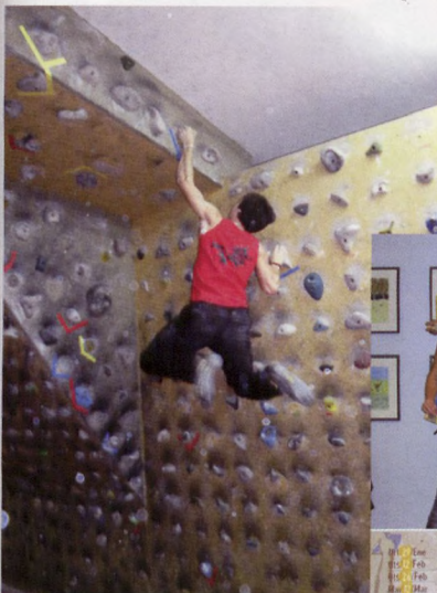
■ Liga de Boulder en Amurrio