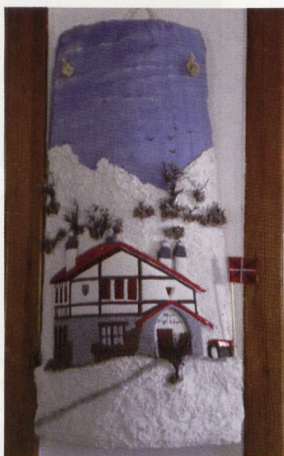
Teja con el refugio de Arraba

El 15 de mayo se celebró la última salida del programa con una marcha montañera al Arrindamendi (230 m) en Zornotza y gracias a la colaboración y gestión del AMPA de la Ikastola Karmengo Ama, pasamos una agradable jornada con múltiples talleres (tirolina, rocódromo, slack-line, exposición de las obras del concurso fotográfico), pinchos y música.