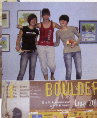
■ Liga de Boulder en Estadio