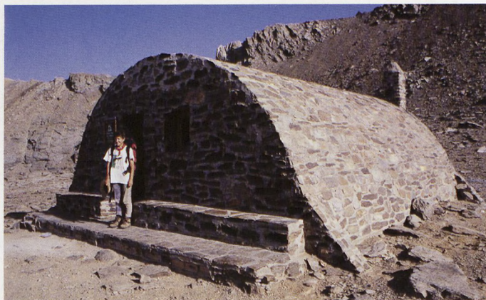
■ La Calderako aterpea

Atzera itzulirik, Elorrieta aterpe zaharren gainean utzi dugun beste lerroa berrartuta, Cerro del Caballo aldera abiatzen gara berriz ere.