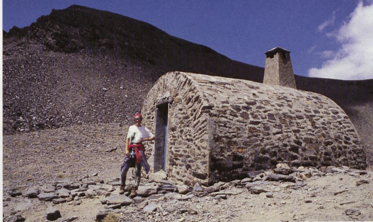
■ Cerro del Caballo eta aterpea

Maparen batean Atalaya izen nahasgarria ematen zaio, eta beste nonbait osoagoa litzatekeen Atalaya del Cuervo ere aurkitzen dugu. Bigarren mailako azpigailurra du iparmendebaldean, Mojón Alto izenekoa (3117) X.474328 Y.4106444. Mapa batzuek, gainera,