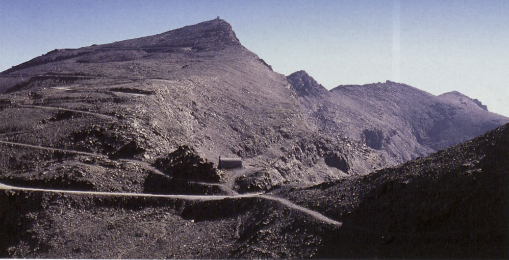
■ La Carihuela eta Veleta