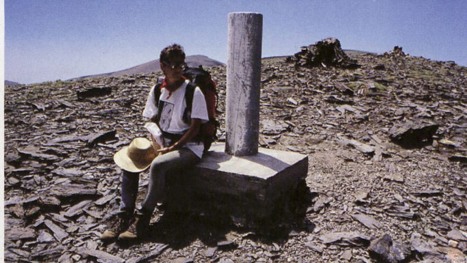
■ Picón de Jérez izeneko erpinuean