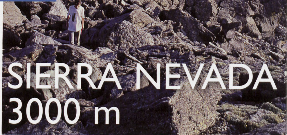
■ Puntal del Goterón

Jarraian eskaintzen den lerrokadako altitude guztiak Mapa Topográfico Nacional delakoaren 1:25000 eskalako kartografiatik hartu dira (1027-II, III eta IV orriak, 2004ko edizioa). Aipatzen diren UTM koordenatuak, ordea, 30S eremuak dira eta ED50 datum-aren erreferentzia dute.