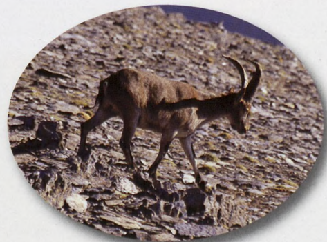
■ Basahuntza Río Seco aldean