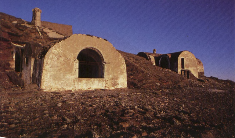
■ Elorrieta aterpea