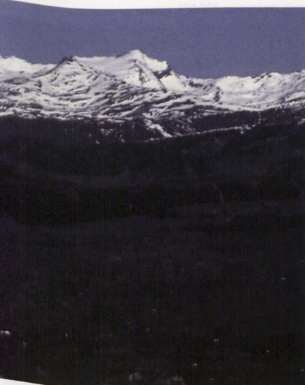
■ Mulhacén eta Alcazaba iparraldetik

Iparraldean Alcazabak badu azpigailur bat, prominentzia gehiegi eduki ez arren, oso nabarmena dena, malda asko aldatzen delako eta iparraldeko kanuto bat haren ondora irteten delako. Puntal del Goterón du izena (3232) X.473487 Y.4102832. Puntal del Goterón honen iparraldeko gandor tentearen azpian badago mapetan akotaturik agertzen den bigarren mailako beste azpigailur bat, Antecima noreste del Puntal del Goterón (3066) deit genezakeena X.473696 Y.4103096. Alcazabaren kontrako aldean beste azpigailur bat identifika daiteke, Antecima suroeste de Alcazaba (3315) X.473136 Y.4102320.