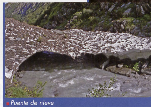
■ Puente de nieve

De vuelta a la horcada que separa las dos cimas, optamos por acortar el itinerario de retorno, deslizándonos por la inestable ladera sur. Bajando directo se enlaza con la ruta de ascenso en un promontorio situado bajo el contrafuerte de la antecima. Yendo más a la izquierda (SE) se baja por pendientes de roca o neveros hasta la laguna. Volviendo ya sobre nuestros pasos, recuperamos unos 100 metros de altura para volver por la cresta al Hochtortcharte (2575 m) y al parking del Hochtort-tunnel (2500 m) (3.45 h).