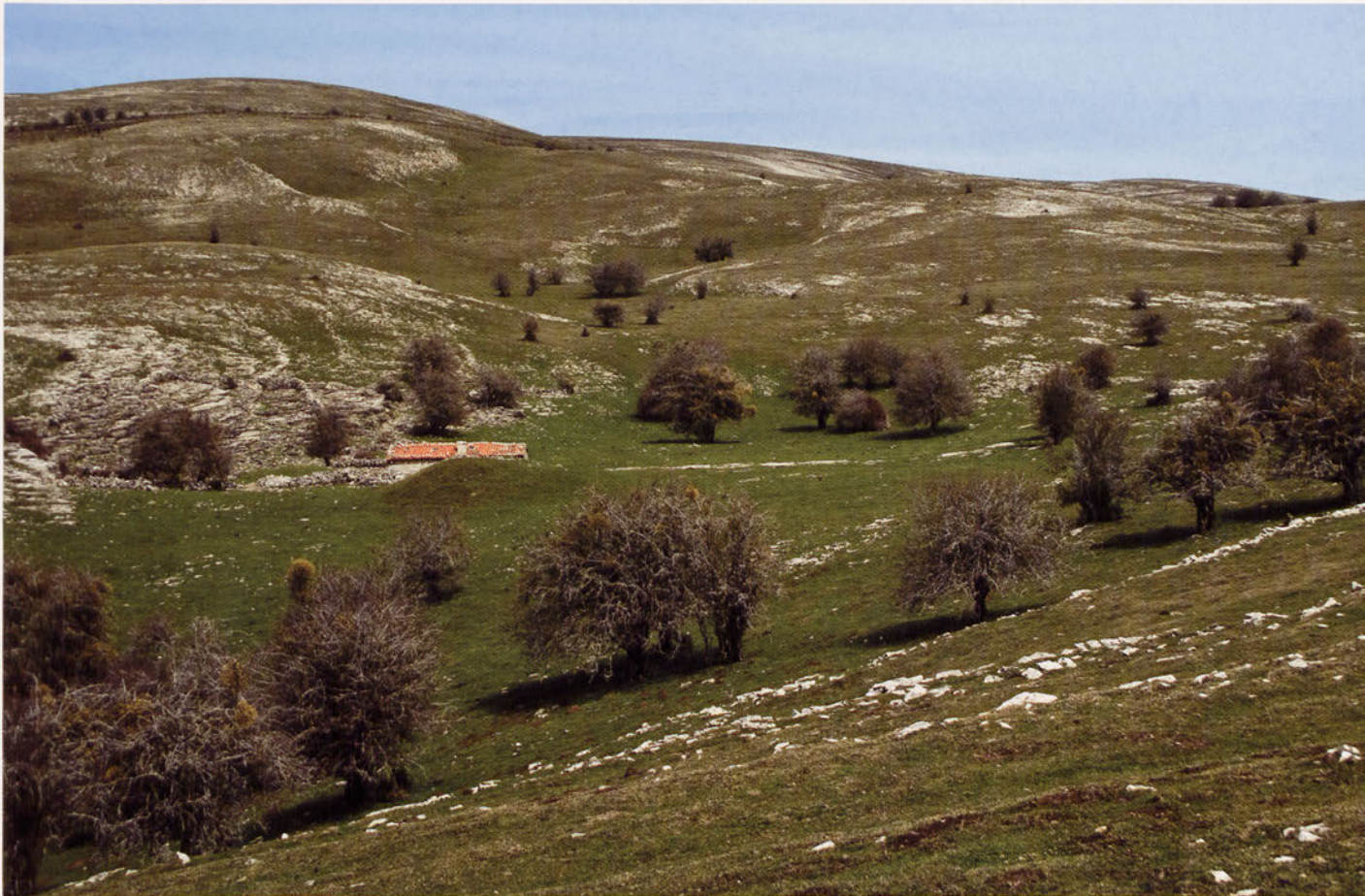
■ Raso de Soosa y txabola de pastores.

nentes del Maestrichtense y del Terciario (Paleoceno y Eoceno Medio), de indudable origen marino.