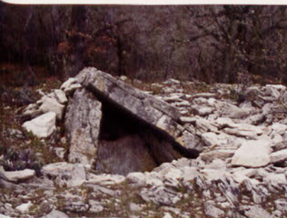
■ Dolmen de Treku.