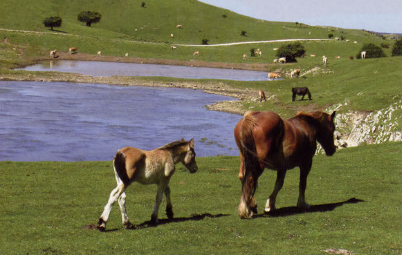
■ Ganado junto a Latorkobaltsa.