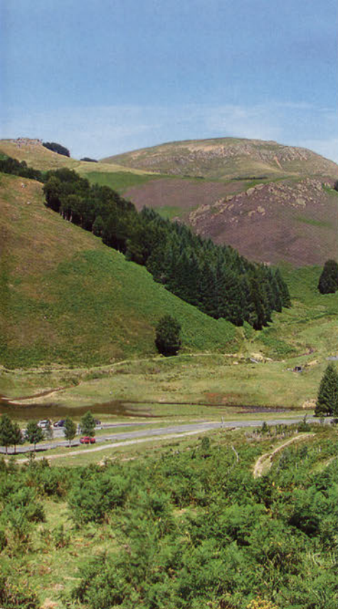
■ Iratisoroko parajeak. Argazkia: José Luis Solana "Solasaga"