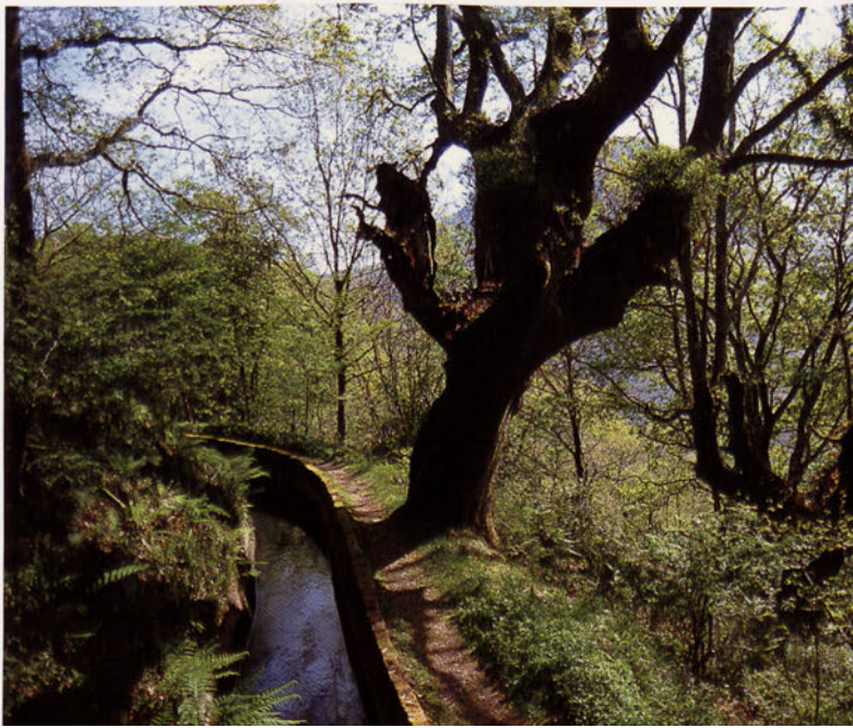
■ Aiako harria inguratzen duen ubidea.

Aiako harriak izen bereko parke naturala ere badu. 1995. urtean osatu zen sarea bost udalerritako eremuekin: Oartzun, Irun, Errenteria-Orereta, Hernani eta Donostia, hain zuzen. Parke naturalak dituen 6913 hektareek Gipuzkoako parke natural handienetako bat osatzen dute eta lur eremu horren azalera gehiena publikoa da