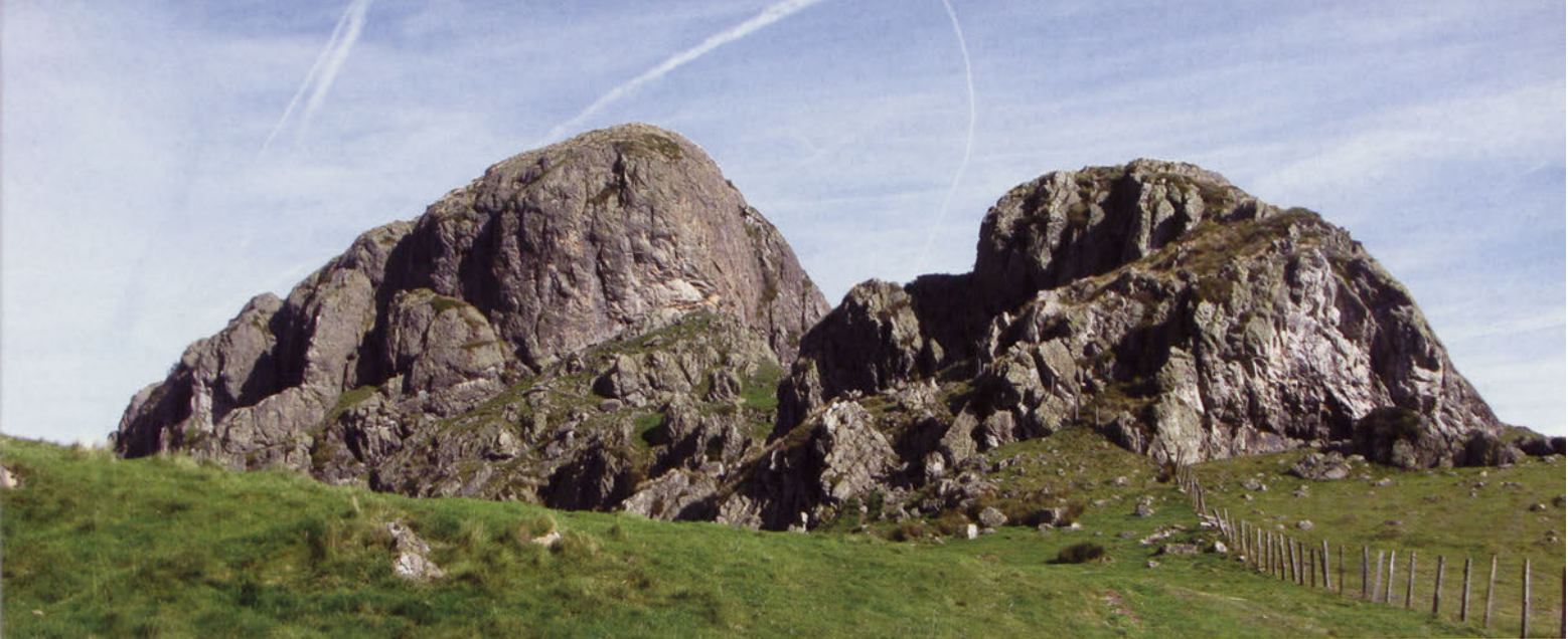
■ Erroilbide Arrisorotik.