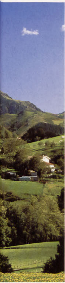
■ Arditurriko meategiak.