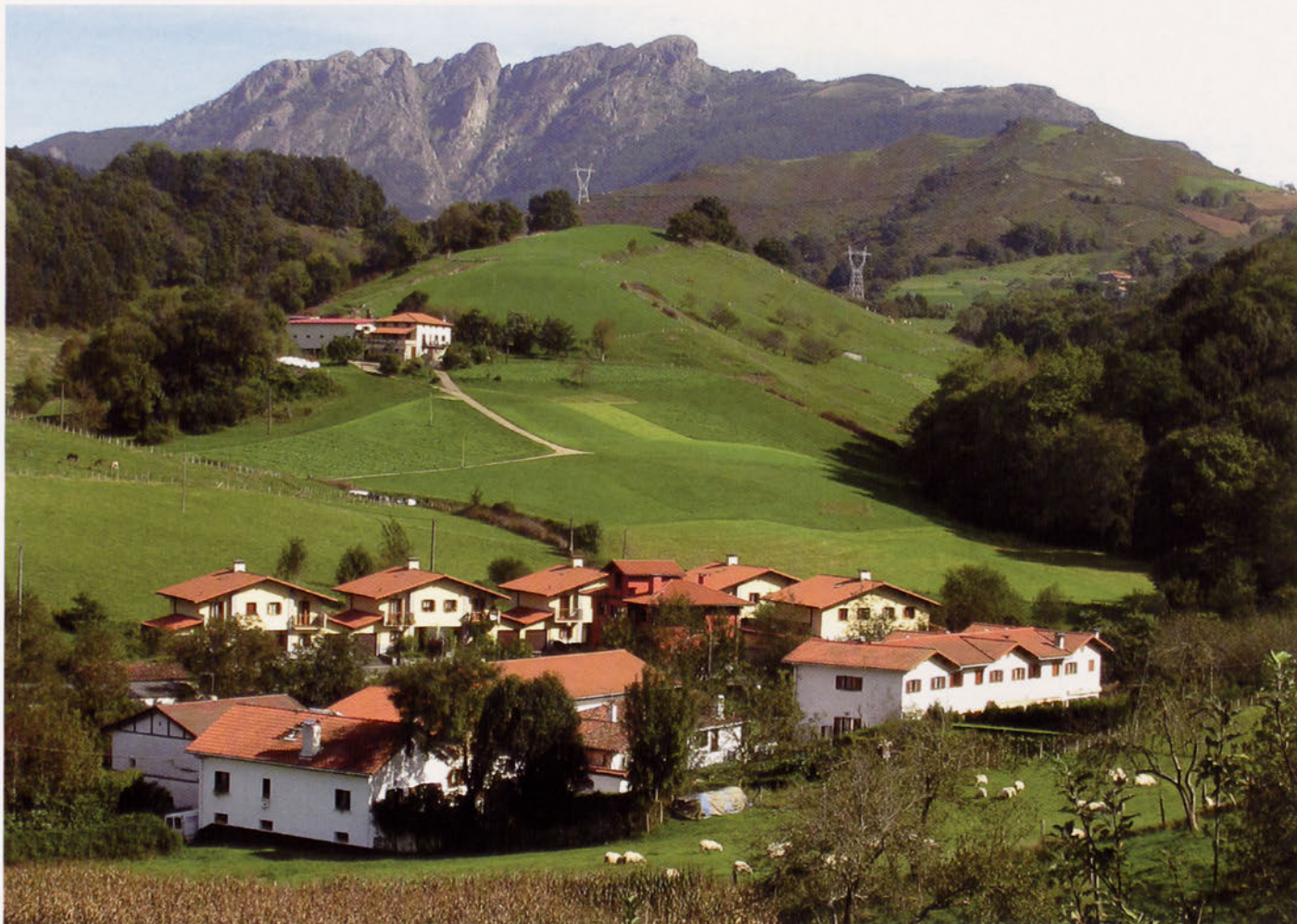
■ Aiako Harria Karrika auzotik.