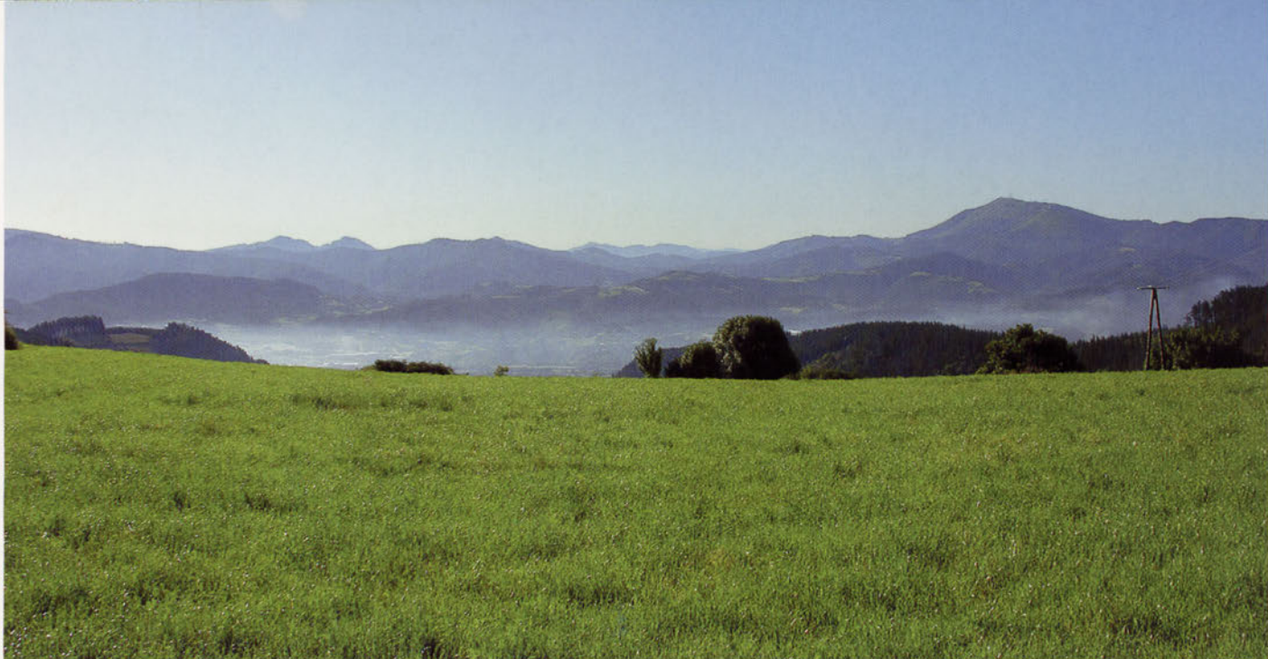
■ Campiña de Urdaibai.