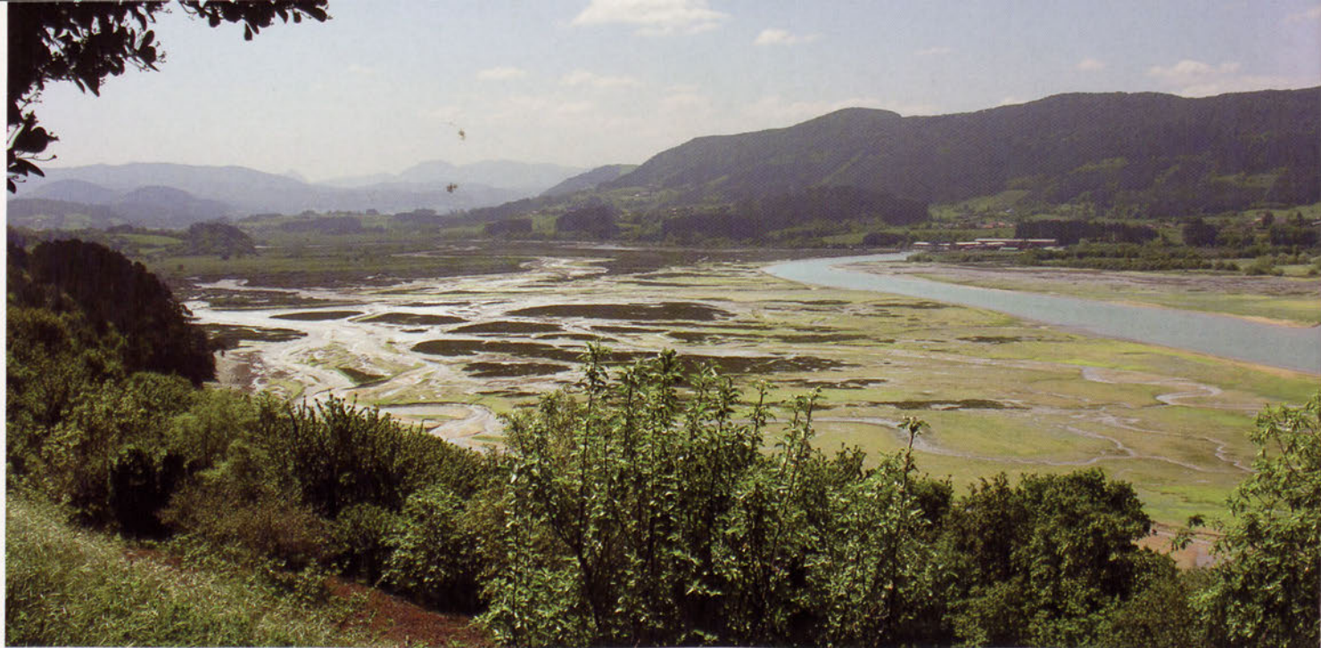
■ La marisma vista desde Kanala.

Continuamos nuestro itinerario, descendiendo por este camino ahora ya entre plantaciones de pinos y eucaliptos, hasta llegar a un depósito de agua. En el mismo tomamos el camino de la izquierda, atravesamos el barrio de Durukiz y descendiendo llegamos a la carretera general, dejando el frontón a la izquierda. Aquí giramos a la derecha hasta el cruce principal y después a la izquierda para llegar al núcleo del pueblo de Ibarrangelu, donde está la iglesia de San Andrés.