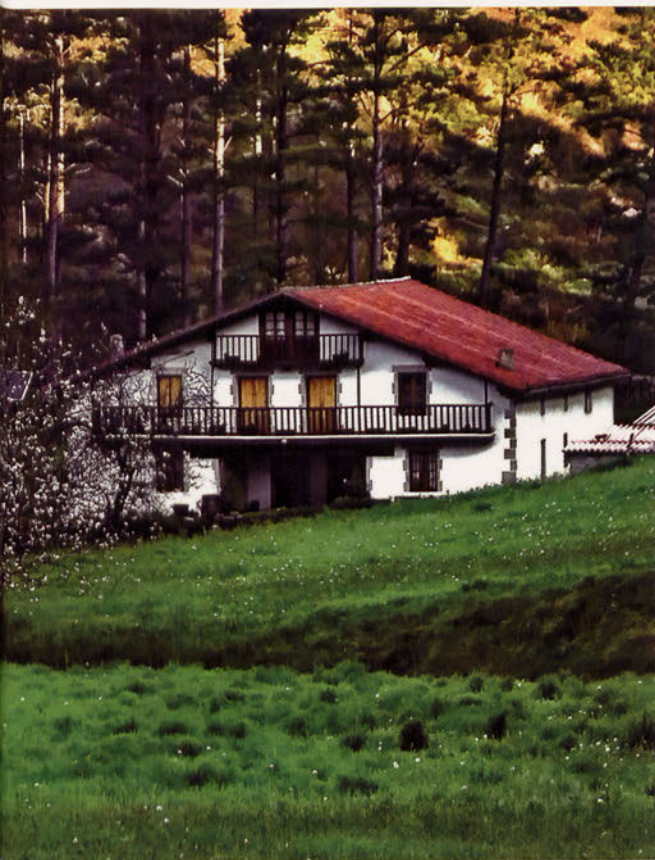
■ Caserío en Morga.