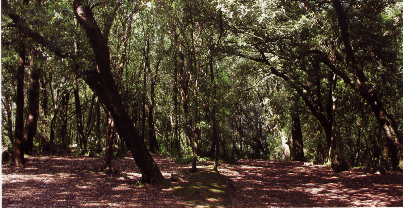
■ Encinar Cantábrico.