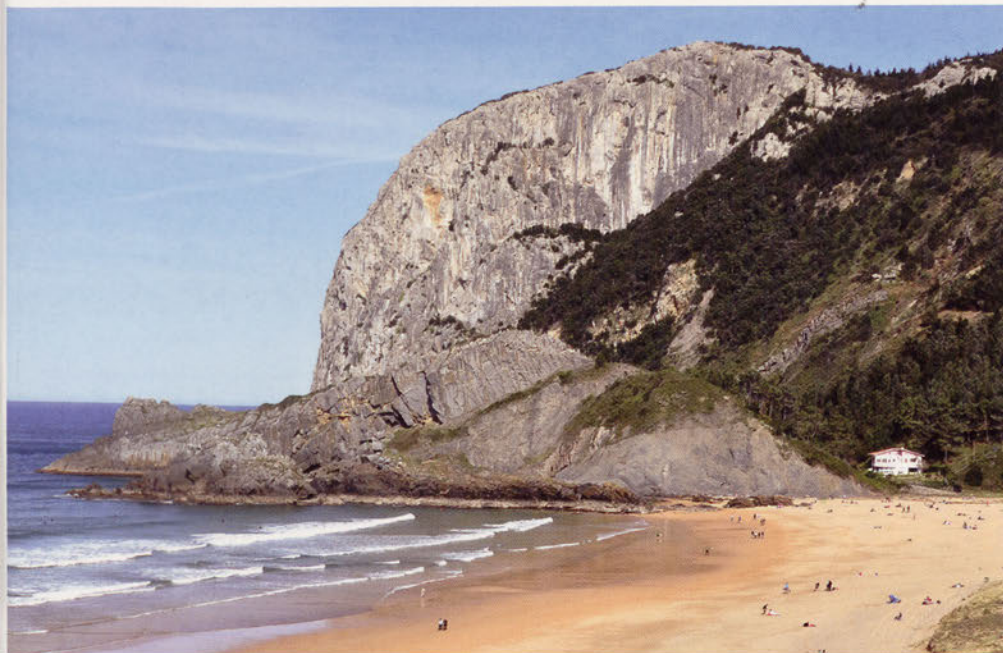
■ El monte Ogoño visto desde la playa de Laga.

En este punto dejaremos el camino asfaltado y torciendo a la derecha comenzaremos a bajar por un sendero entre pinos hasta llegar a las vías del tren. Cruzaremos las vías con mucha precaución y tras pasar por un pequeño tramo de matorrales entraremos en una pista bien acondicionada que girando a izquierda y tras un bonito paseo junto a la ría, nos llevará al corte de la misma. Una vez aquí las hermosas vistas se sucederán, pues desde este punto, tomando una pequeña senda a nuestra izquierda, la ruta continuará junto a la ría llegando de este modo a los antiguos embarcaderos y tejera de Murueta. En esta tejera, existente ya en el s. XVI, se fabricaban tejas, ladrillos y cal. Continuando con el recorrido dejaremos la tejera a nuestra izquierda para seguir por una pequeña senda en plena marisma y tras ver a lo lejos los astilleros de Murueta encontrarnos de nuevo con las vías del tren.