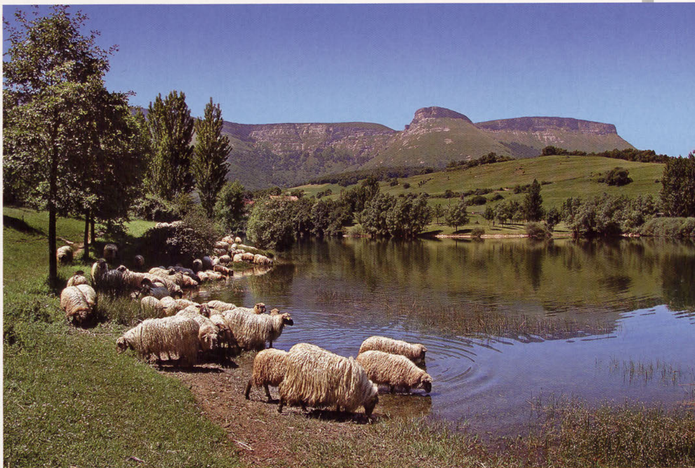
■ Artaldea Maroñoko urtegian, Gorobel mendilerroa atzean duela.