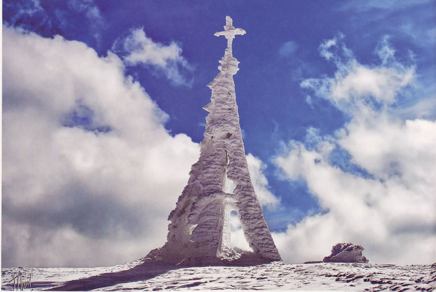
■ Gorbeiaiko gurutzeta izozte gogor baten ondoren.

zeharkatzen dituen Errege-abelbidea. Ekain aldean ganadua Bardeatik Pirinioetara eraman ohi da eta irailean, berriz, elurrak goi-larreak estaltzen dituenean itzuli egiten dira, negua hemengo lur epeletan igarotzeko. Bostehun urte baino gehiagoko ohitura honek, Erribera eta Zaraitzu nahiz Erronkariko herrien artean lotura estuak sortu ditu.