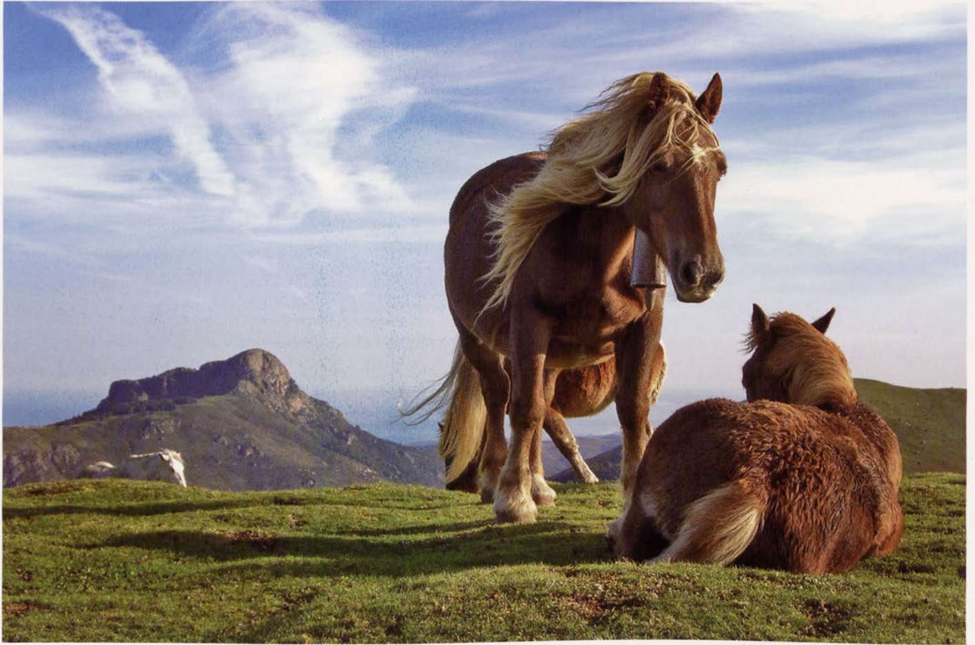
■ Behorak Bianditzen. Wikipediako argazkirik onenari 2008ko saria.

bertan hausten diren olatuen bila dabilta surflari ausartak, 1957 Europan lehen aldiz surfa egin zen leku berean.