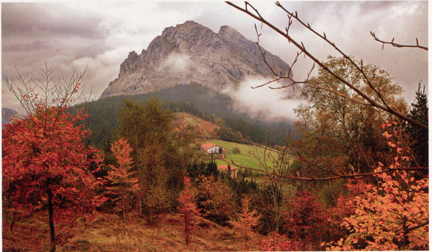
■ Udazkena Durangaldean.

eta Armañon mendien magalak zeharkatuz, euriaren higadurak modelatu dituen Raneroko kareharrizko mendilerroan dauden leize, arraila eta haitzuloek zizelatutako labirintoetara gerturatu naiz. Mendigune malkartsu honetan, interes espeleologiko handia duten Pozalagua, La Torca del Carlista, eta Ventalaperrako haitzuloei bizkarra eman eta Ordunte aldera jo dut. Zalaman hasi eta Kolitzan bukatuz, hamahiru mendik osatzen duten mendilerro honi jarraiki, kostaren eta Donejakue bidearen beraren lotura egiten zuten Balmasedako Erdi Aroko Zubi Zahar ezagunaren ondora jaitsi naiz.