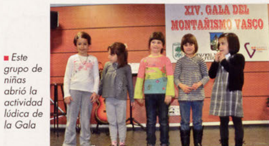
■ Este grupo de niñas abrió la actividad lúdica de la Gala