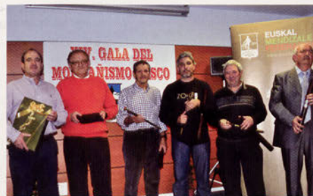
■ El G.A. Gallarraga entregó diferentes obsequios