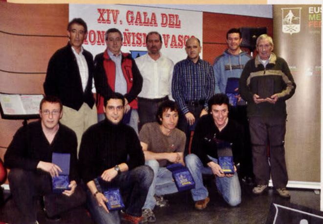
■ Todos los premiados por la EMF

Premio "Sheve Peña" de Marchas Largo Recorrido. Lo nominarán los marchadores en la Fiesta de Finalistas de MLR.