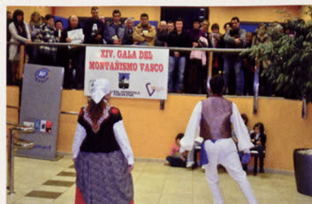
■ Aurreku de honor en el hall de la Casa de Cultura de Sodupe