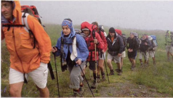
■ Sorebois leporantz taldea ilaran

La Navisence errekaen beste aldera pasa eta ohi bezala aldapan gora jarri gara. Basoan hezetasun handia dago eta lehen izerdi tantak berehala hasi dira kopetatik irristatzen. Zenbait tartetan aldapa pikoa da eta bezperan izandako ekaitzak lurra busti eta labankorra utzi du. Sigi-sagan marrazten den xenda jarraituz, basotik atera eta zintzurra freskatzeko lehen atsedena hartu dugu. Eski pistetara doan bide zabala jarraitu dugu laino artean Soreboiseko kafetegiaren ondora iritsi arte (2.438 m). Atzera begiratu eta aukera izan dugu une batez Bishorn eta Weisshorn mendien gailurrak hodei artean ikusteko.