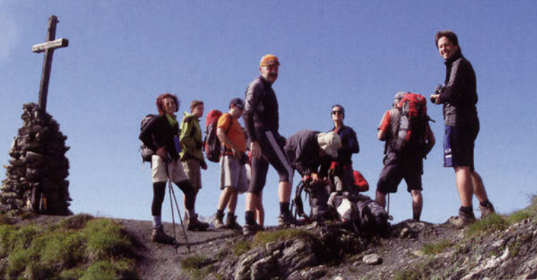
■ Taldea Col de Torrenten