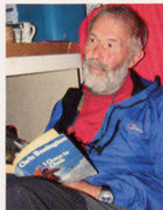
■ Chris Bonington estará en Bilbao e Iruña