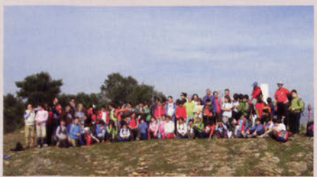
■ Salida de Deporte Escolar