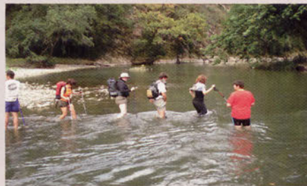
■ Travesía de la Red Cométe

Se está trabajando en las redes de senderos de los parques naturales de Gipuzkoa, estando próxima la finalización del de Aiako Harria, y muy avanzado el del parque natural de Pagoeta. Hay que dejar constancia de que todos estos trabajos son posibles gracias a la estrecha colaboración de la GMF con el Departamento de Desarrollo Rural de la Diputación Foral.