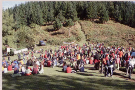
■ Día del Finalista Infantil en Arrate