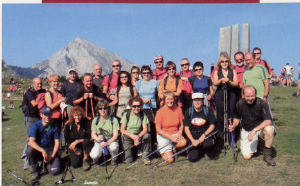
■ Besaiden 2009ko irailean egindako irteeran

elkarte eta 901 federatu zeuden Euskal Herrian eta 1951rako 50 elkarte eta 3361 bazkide.