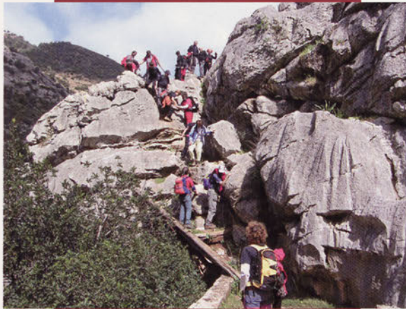
■ Sierra de las Nieves mendilerroan (Málaga-Andaluzia) 2008ko Aste Santuan

1974. urtean ohiko jardueraz gainera, umeentzako programa ere egin zuten, horretarako batzorde bat osaturik. Helduentzat bi irteera antolatu ziren hilean, baita pelikulak eta diapositiba emanaldiak ere. Haurrentzat, berriz, hilean irteera bat