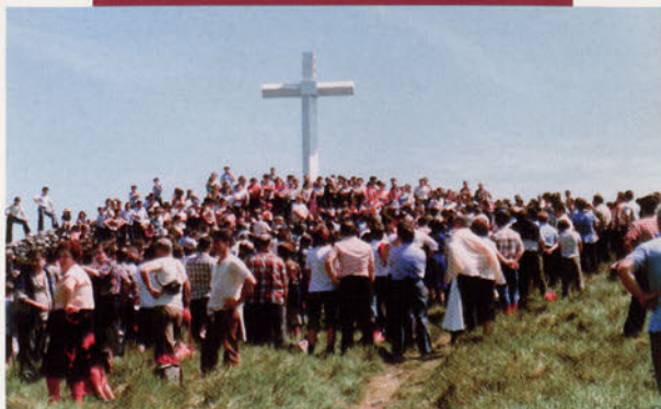
■ Jendetza bildu zen 1979ko ekaineko Pagoeta Egunean, borda inauguratu zela eta