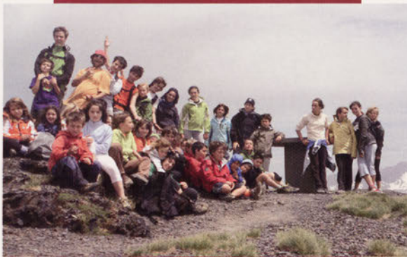
■ Pagoeta Elkarteko mendizale gazteak, etorkizuneko harrobia