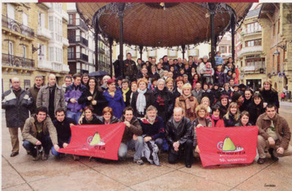
■ Pagoetako mendizaleak Zarauzko Musika Plazan Pagoeta M. Elkartearen 50. urteurrena ospatzen 2008ko abenduaren 14an

eta pelikula nahiz diapositiba emanaldi bat egitea aurreikusi zuten. Aipatzekoa da urte honetan Aralarreara egindako irteera batean hiru autobus bete zirela 133 lagunekin.