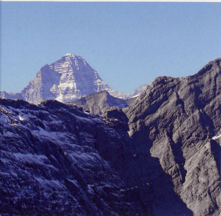
■ Assiniboine 3618 m