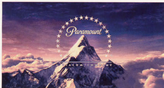
■ No es el Cervino sino el Assiniboine

En Oceanía se localiza uno de los Cervinos que merece ese sobrenombre con más motivos. Se trata