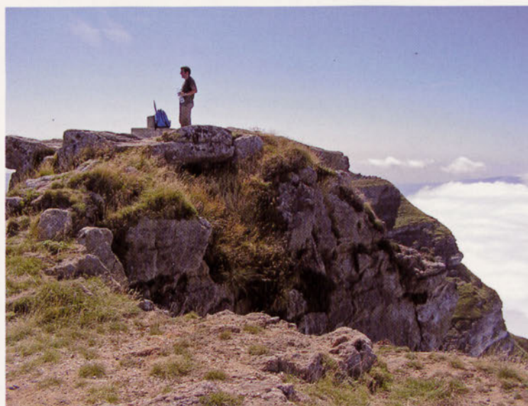
■ Cima principal del Castro Valnera