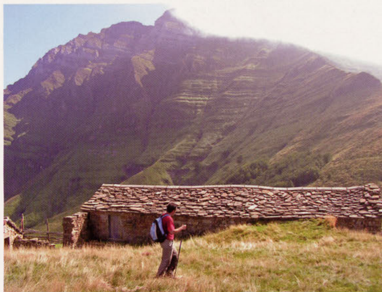
■ Cabañas de Colina y el Castro Valnera