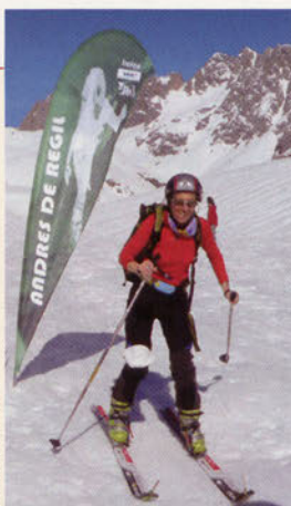
FOTO TRAVESIA REGIL