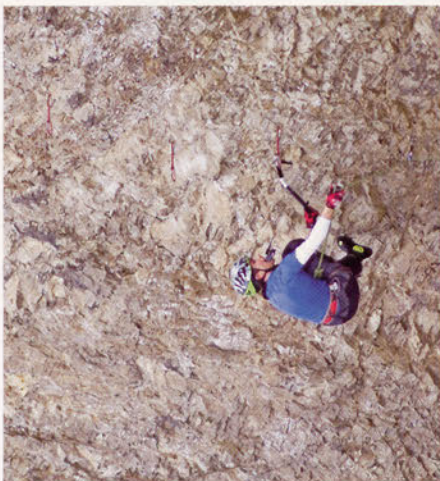
■ Erlantz Díaz en una de las escasas repeticiones de "Brutal Fang" (Pineta)

El escalador Erlantz Díaz, a pesar de su escasa experiencia en el mixto deportivo de gran dificultad, se lleva una de las escasas repeticiones de la vía más dura de la Península: "Brutal Fang": M12/+ (D12 en seco).