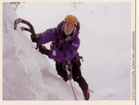
■ En Nuit Blanche