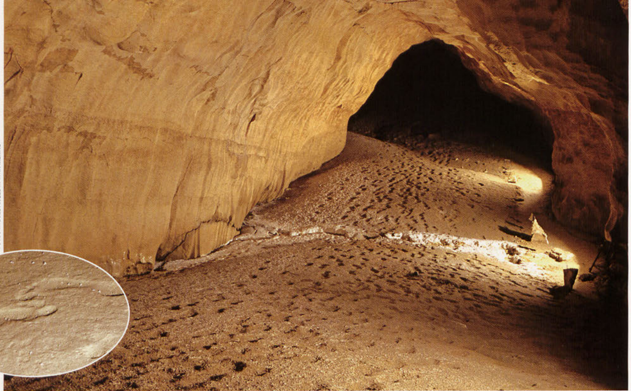
■ Rastros de pisadas humanas en las Galerías de las Huellas