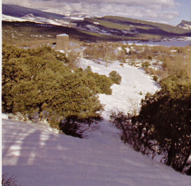
■ Exterior de Ojo Guareña desde el Páramo de Villamartín

Este complejo se ha formado gracias a la labor erosiva de los ríos Guareña y Trema, cuyas aguas se han estado sumiendo, durante cientos de miles de años, hacia un acuífero subterráneo existente en el subsuelo, horadando la montaña hasta formar la red de galerías conocida en la actualidad. El río Guareña chocó contra el farallón calizo formando un valle ciego en el que, poco a poco, los sucesivos sumideros fueron encajándose hasta el nivel del actual Ojo del Guareña, mientras que en los más antiguos y elevados se ubicó la ermita de San Tirso y San Bernabé, cristianizando este espacio. Por su parte, el río Trema, gracias a su mayor caudal, logró abrir un pequeño cañón, jalonado en ambas már-