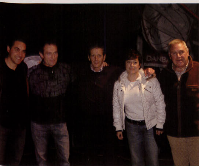
■ La nueva Junta Directiva de la EMF