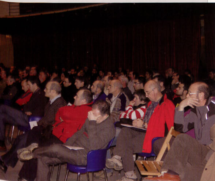
■ Asistentes a la Asamblea de Elgeta