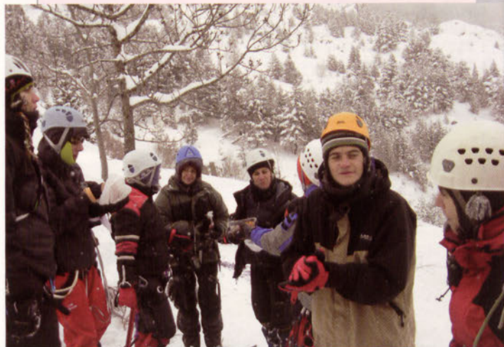
■ El mal tiempo y la nieve acompañó a los cursos

El sábado, en Oñati, se enseñaron los nudos básicos, repaso del material de escalada deportiva, cómo asegurar correctamente con los aseguradores-descendedores, técnicas de progresión en placa, oposición, desplome, techos, técnicas de chapaje correcto de la cuerda y técnicas psicológicas para reducir el miedo a la caída. El domingo continuaron las prácticas en Ariznabarra con técnicas de rápel, cómo asegurar descuelgues dudosos, control de la caída y escaladas de primero de cuerda. Por la tarde se reanudó el curso en Hegoalde. Todas las mujeres terminaron el curso escalando de primeras de cuerda en dificultades de 4+ hasta 6a+. Buen ambiente y agradecimientos por lo aprendido en el curso.