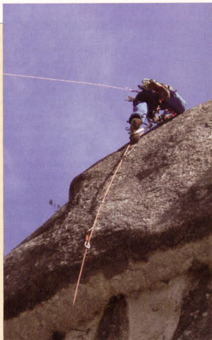
■ Dos momentos de las prácticas del equipo de jóvenes alpinistas

El año concluyó con las prácticas de Alpinismo, realizadas en Gavarnie del 26 al 31 de diciembre. Después de una copiosa nevada escalaron dos líneas de unos 300 m de longitud y dificultades de II/4-4+. Al día siguiente con los