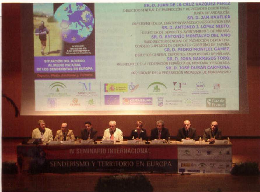
■ Seminario de la ERA en Málaga