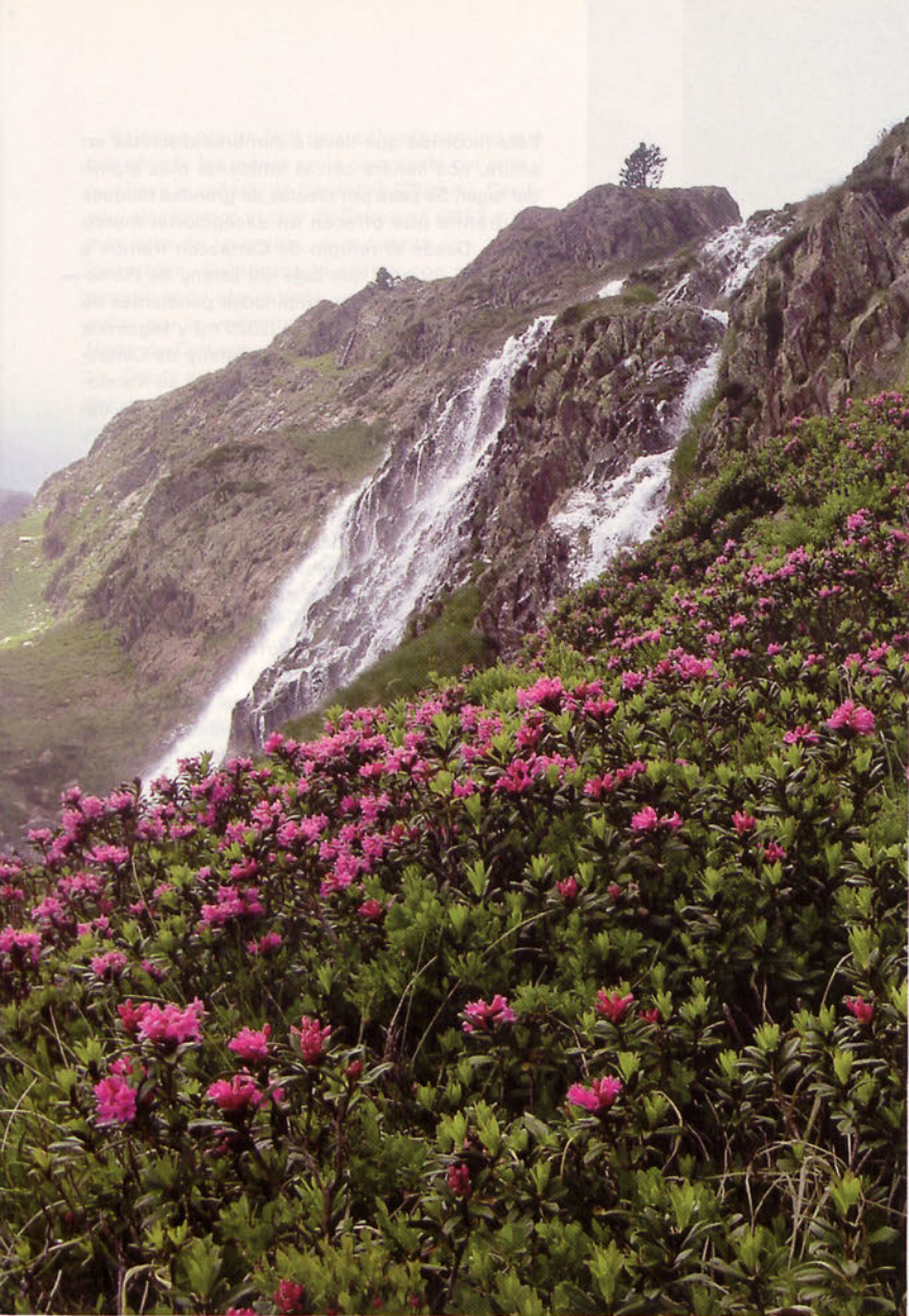
■ Cascada de Certscan