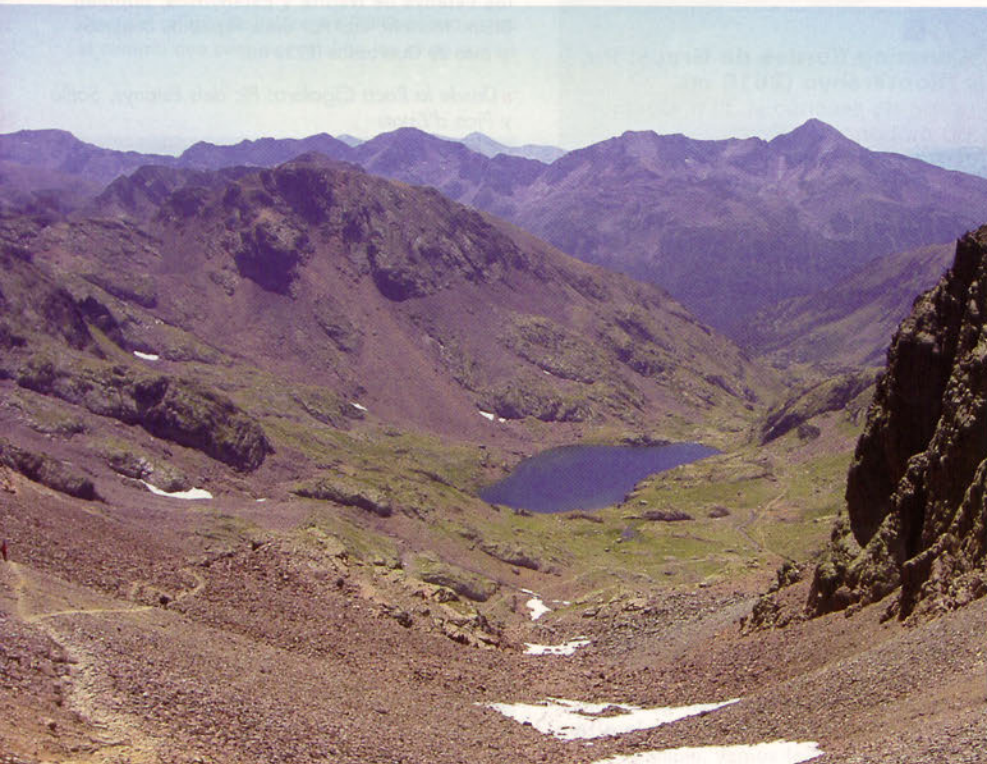
■ Bajada hacia Vallferrera desde el Port de Sotllo