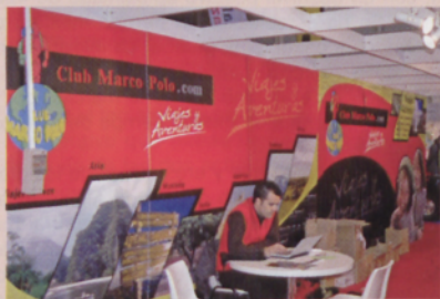
■ Stands de la EMF, Aralar Kiroiak y Club Marco Polo