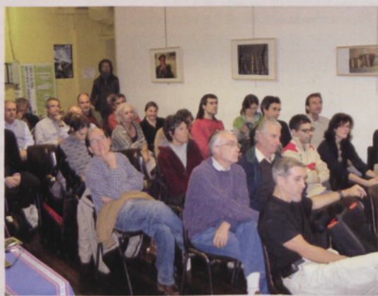
■ Público asistente al acto

Para más información: www.feec.cat y www.euskaletxeak.org