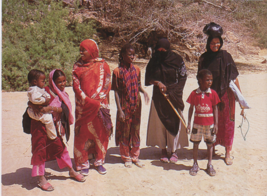
■ Emakume tuareg nomaden taldea

Aljeriari buruz europarrok dugun iritzia, gatazka politikoak eta terrorismoak jotako herrialdearena da, bertara bidaiatzea arriskutsua izanik. Ideia hau ez da erabat egiazkoa. Badira bai gatazka politikoak eta honi eutsiriko gertakari latzak. Baina hauek Aljer hiriburura eta inguruetara mugatzen dira. Guk ezagutu nahi dugun ingurunea Aljer hiriburutik bi mila kilometro hegoaldera dago, tuaregen ohitura eta bizimoduaren eraginpean, aipatutako gatazketatik at. Tuaregak Islamean sinesten duten arren, erlijio honekiko jarrera oso liberala dute. Islama bereganatu zutenetik beren kasa praktikatu dute, beren jatorrizko ohitura eta sinestuetara egokitu. Azken hamarkadetan, herrialdearen hegoaldean ez da Aljeriako gatazka politiko-erlijiosoari lotutako gertakaririk bat ere ezagutu.