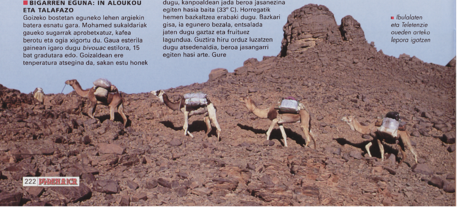
■ Ibulalaten eta Teletenzie oueden arteko lepora igotzen

Arratsaldean norabide berean ibiltzen jarraitu dugu, Assasou izeneko bidegurutzeraino. Handik mendebaldera jo dugu beste ordubetez ipar mendebaldera luzatzen den Talafazo ouedean sartu arte. Bidean plastikoz, adarrez eta ontziez osatutako txabola modukoak aurkitu ditugu. Familia nomaden bizilekuak dira. Sasoi batez inguru batean egon ondoren, lekuz aldatu behar izaten dute animalientzako landaretza berria bilatzeko (ardiak, ahuntzak, behiak eta dromedarioak). Bizilekuak normalean antzinatik finkatuta izan ohi dituzte eta belaunaldiz belaunaldi leku berberetara joateko ohitura izan dute. Horregatik ez dituzte jabetza guztiak aldean eramaten. Leku bakoitzean bizi izateko oinarriko materialak lagatzen dituzte gordeta. Bidaia honetan bi familia nomadarekin egin dugu topo. Emakumez eta umeez osatutako