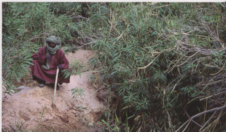
■ Essendilene oueden landaretzak uraren hurbiltasuna adierazten digu

Zazpigarren eguneko eguerdi inguruan, Erg Admerreko egundoko duna katea ikusten hasten gara. Ametsetako paisaia hori lehenbailehen zapaldu nahi badugu ere, ezin dugu erritmoa azkartu, bertan dagoela iruditu arren, bi orduko ibilaldia baitago bertara heltzeko. Dunen paisaia honek mirestuta gauzka laurok eta bertara heldutakoan, atsedean hartu gabe, gora eta behera hasi gara umeen moduan. Gaua eta biharamuneko goiza hemen pasatuko ditugu, Djanetera bueltatzeko kotxea gure bila etorri arte. Oraingoan ere, eguzkiari azken agurra emateko inguruko duna garaienera igo dugu. Haizea baretu egin da eta argi-itzalek irudi dotoreak moldatuta, bizitza ematen diote harearen handitasunari. Bertatik geure pausuen