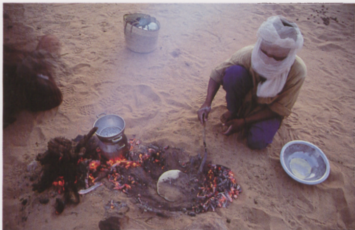
■ Moussak gaveru ogia egiten du, ikatzaren azpian opila harea artean egosirik

poliki zabalago egiten da. Arroilaren mugak ezartzea gero eta zailago egiten zaigu, harrizko eraketak gutxika-gutxika desagertuz baitoaz. Gure aurrean hori koloreko demaseko hutsa zabalzen da. Gerizpe faltak nekealdia nabarmenago egiten du. Erreferentzia puntu gutxiago dugunez, badirudi ez dugula ezer aurreratzen. Eskerrak haize arin eta mehe batek laguntzen digula. Nahiz eta hareazko ale txikiek aurpegian jo, gustura agurtzen ditugu, bero handia moteltzen baitute eta, horri esker, ez gara 40° Cetatik gora heltzen. Bazkalordua akazia bakarti bat aurkitzean egiten dugu, bestelako gerizperik ez baitago hemen.