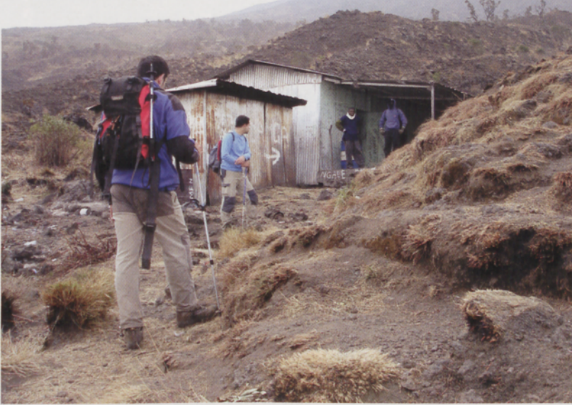
■ En el segundo refugio (2852 m)