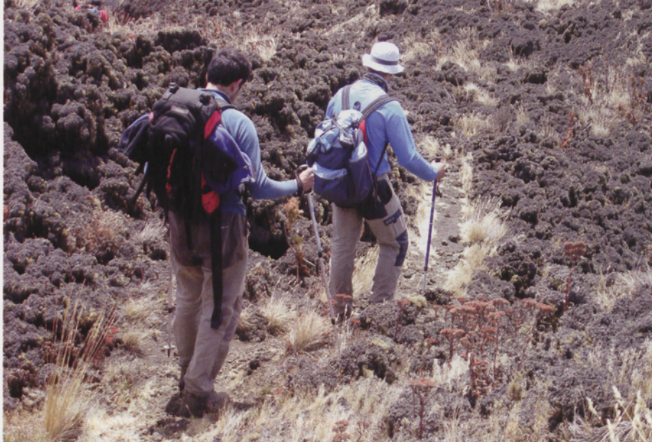
■ Siguiendo el río de lava