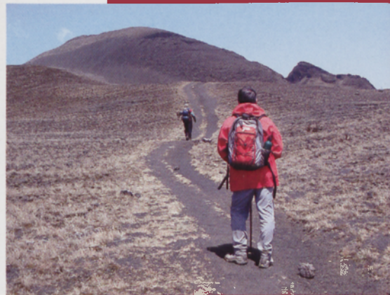
■ Último tramo hacia la cumbre