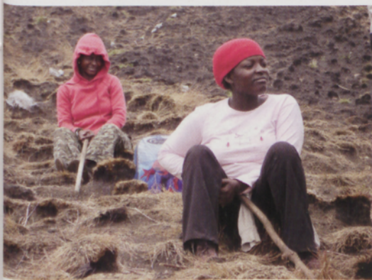
■ Montañeras locales

presbiteriana. No hay tráfico. Nadie se atreve a desafiar la huelga que ha paralizado la región en protesta por el aumento del precio de la gasolina. Argumentan que la extracción del petróleo de las cercanas aguas del Golfo no les supone ninguna ventaja. Mientras, los grises tejados de hojalata de las chabolas se unen a la neblina impregnando el paisaje con una tonalidad triste. Lagartos de colores vivaces escapan a nuestro paso. Comenzamos a ganar altura sobre terreno abierto en las inmediaciones de una granja-prisión en la que los presos comunes cumplen su condena. Varios hombres talan árboles a golpe de machete mientras hombres viejos de aspecto acartonado se agachan sobre modestas plantaciones en busca de unas patatas dulces, unas piñas... Nos internamos en la selva. El sendero no tiene pérdida posible, el terreno es abrupto, resquebrajado a menudo por raíces que sobresalen del mismo. Con una temperatura que oscila durante todo el año entre los 20° y los 28°C, la elevada humedad nos hace sudar mientras atravesamos la espesura. Resulta un alivio toparnos en un claro con el primero de los refugios (1865 m / 2h 20); apenas un par de construcciones de hojalata elevadas del suelo mediante unos pilares.