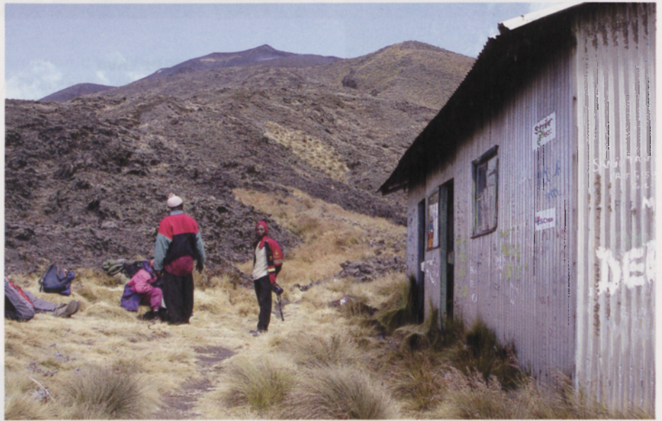
■ Desde el tercer refugio (3775 m)

largo del pasado siglo XX destacaron por su parte los estallidos de 1922 y 1999 desde la vertiente sudoeste. La primera de ellas llevó la lava hasta el propio Océano Atlántico al tiempo que la segunda detuvo su incandescente carrera a escasos 200 m de la costa.