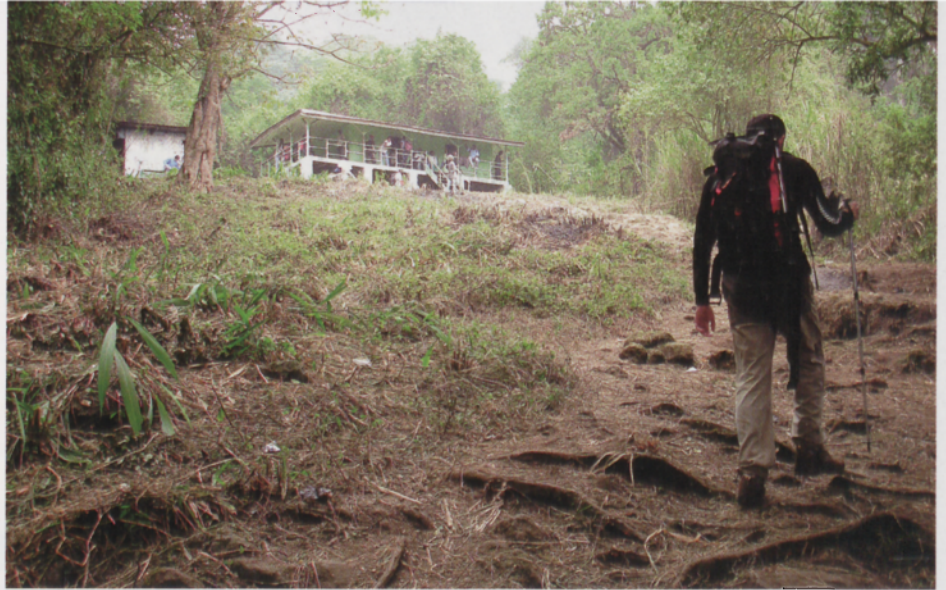
■ Accediendo al primer refugio situado en la selva