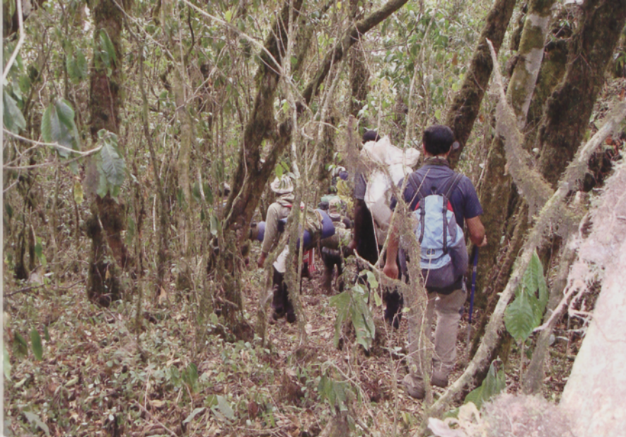
■ Sendero a través de la selva