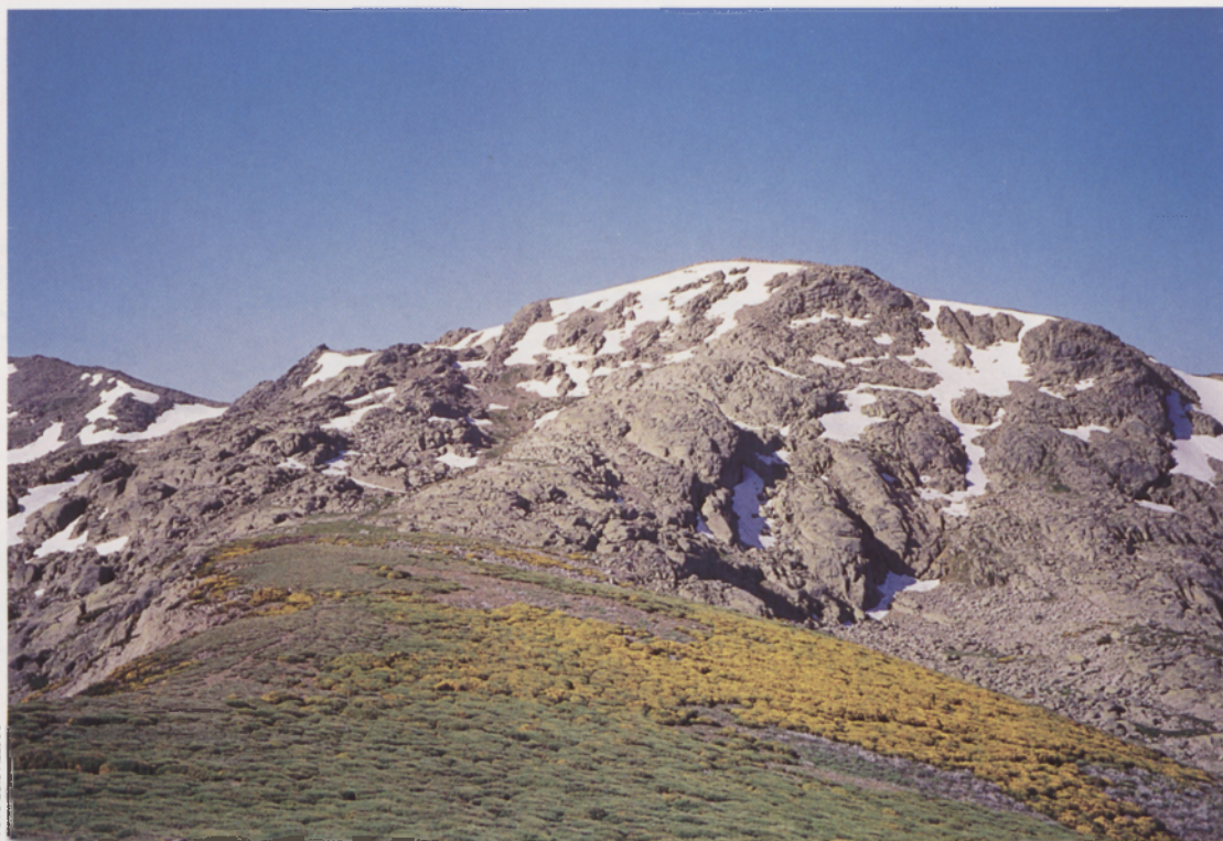
■ Castilfrío, visto desde el Alto del Mojón

entre las que están prácticamente todos los dosmiles emblemáticos de la Sierra de Gredos. Podríamos haberla ampliado aun más bajando el listón, pero creemos que no es conveniente, ya que al ir decreciendo los valores la prominencia deja de ser un dato significativo, siendo las cotas simples elevaciones del cordal.