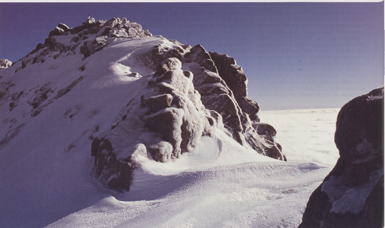
■ Circo de La Covacha. Gredos Occidental

H ACER un listado de los dosmiles principales de Gredos no es una tarea fácil; estamos hablando de un amplio macizo en el que hay numerosas cotas y montañas que deberían figurar en esta lista por diferentes motivos. Para confeccionarla se ha tenido en cuenta el criterio de prominencia, considerando picos principales los que superen los 88 m de prominencia (aproximadamente el 1 % de la altitud del Everest), y figurando como secundarios aquellos cuya prominencia esté comprendida entre los 44 y los 88 m (la mitad del valor anterior). Con ese criterio, tan válido como cualquier otro si lo que pretendemos es cortar la lista en algún punto "lógico", han salido 62 cumbres,