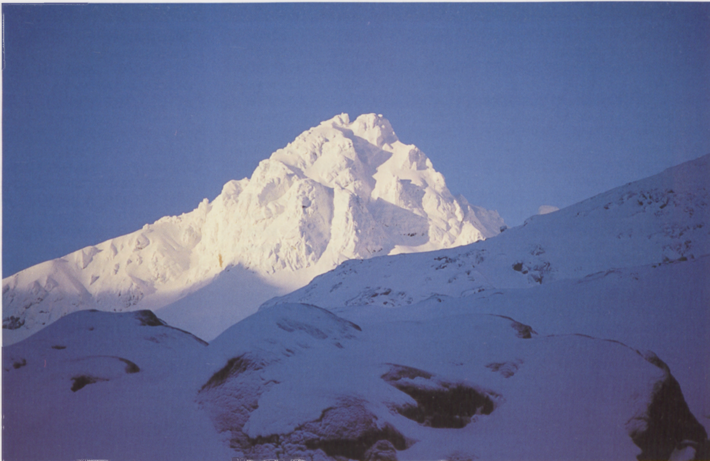
■ El Almanzor. Circo de Gredos. Ávila