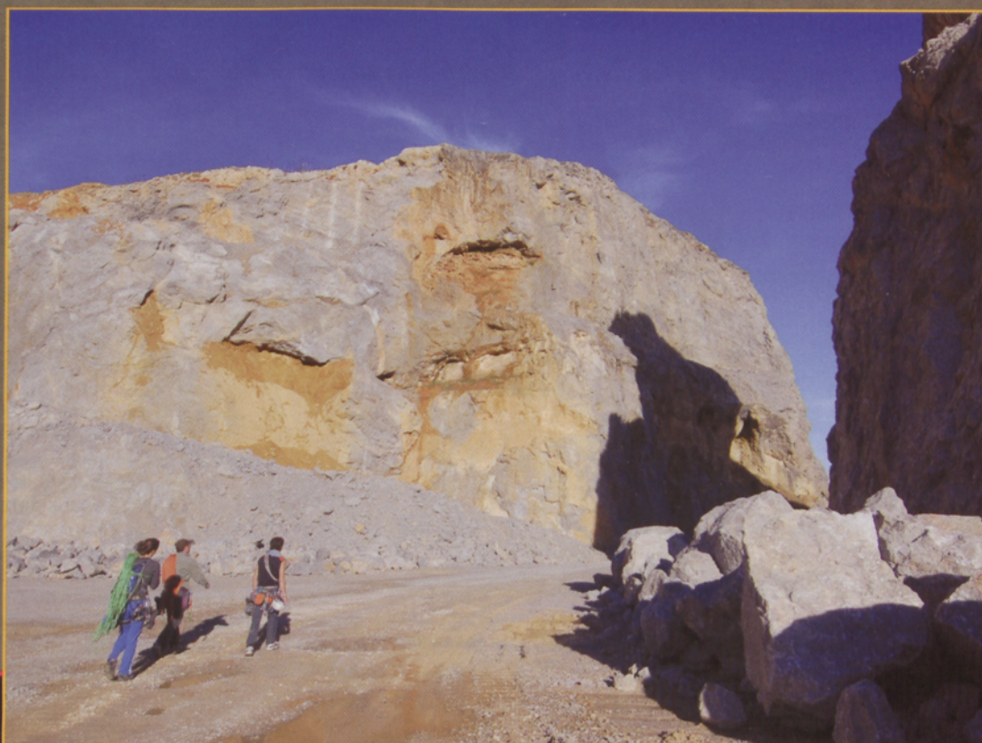
■ Descenso a través de las canteras