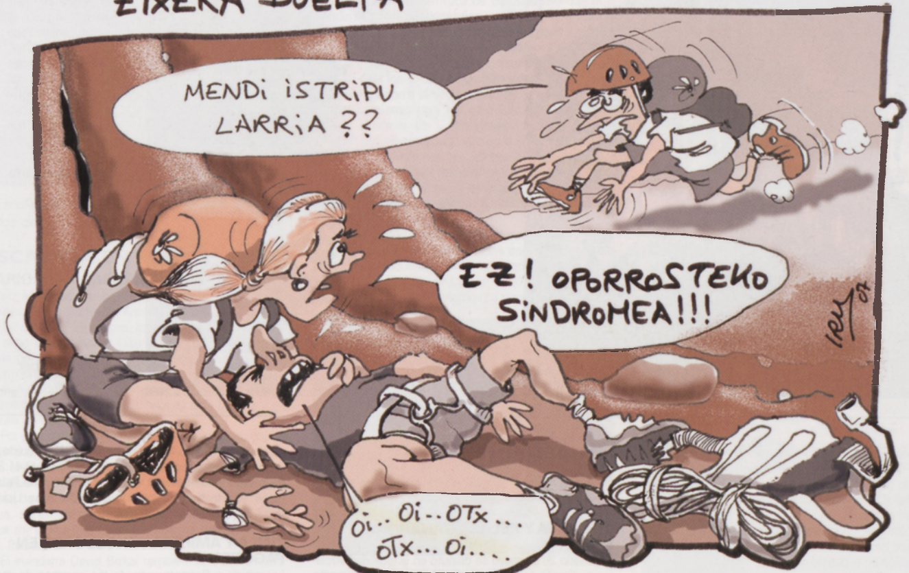
DIBUJO JOSEBA RUIZBETA IIRU