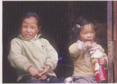
■ Haurrak Sangnasa-n