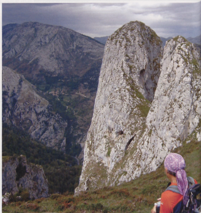
■ El Pico Tiolda

La mayor parte del macizo pertenece a Cantabria, concretamente al municipio que toma, precisamente, el nombre Peñarrubia. Su máxima altura es el Pico Gamonal (1225 m). Hacia el Este el cordal montañoso penetra en el valle de Lamasón, por encima del cual despuntan las cimas de Arria: Picu la Cueva (1002 m) y Cuetu el Castillo (1002 m). Siguiendo el cordal en dirección a La Hermida