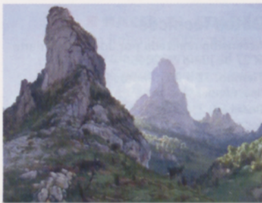
■ Cuadro de Carlos Haes - Desfiladero de La Hermida - 1874 -

La mano de este famoso paisajista del sXIX nos descubrirá una panorámica de agudos picos calcáreos erizados sobre alguna de las canales o desfiladeros que construyen la compleja orografía de los Picos de Europa (1874).