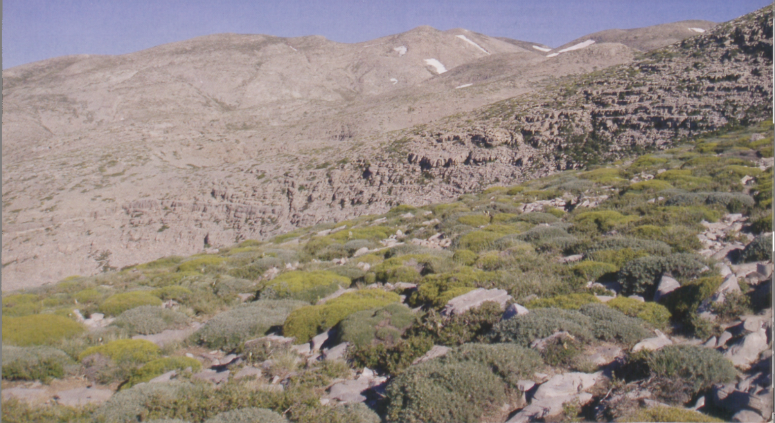
■ Reunión: El Piton des Neiges es el techo de Reunión