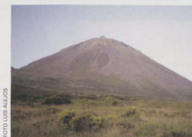
■ Azores: Montanha do Pico