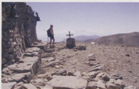
■ Psiloritis, techo de Creta