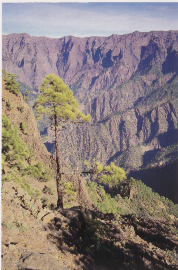
■ La Palma: Roque de los Muchachos