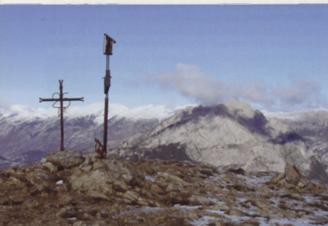
■ El Cap de la Gallina Pelada, cumbre de la sierra de Ensija, con el Pedraforca y el Cadi al fondo