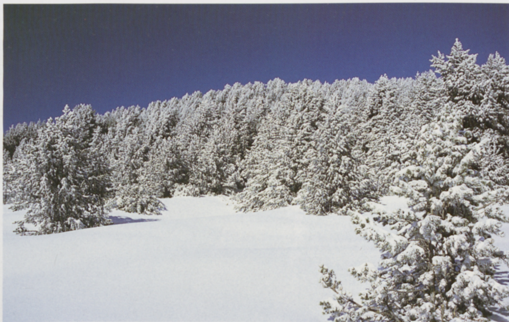
■ Aspecto invernal del bosque de pino negro cerca de la cumbre de los Rasos de Peguera