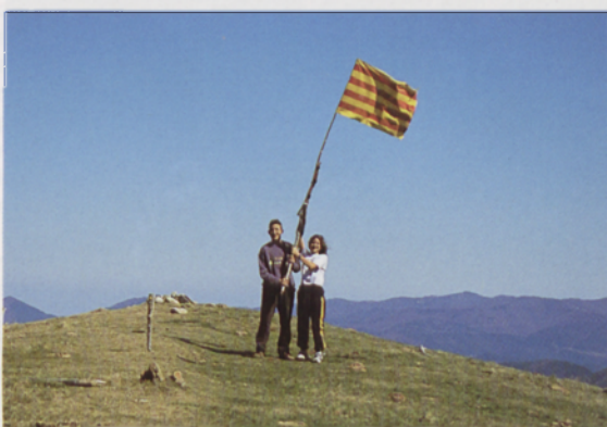
■ Cumbre del Puig Lluent