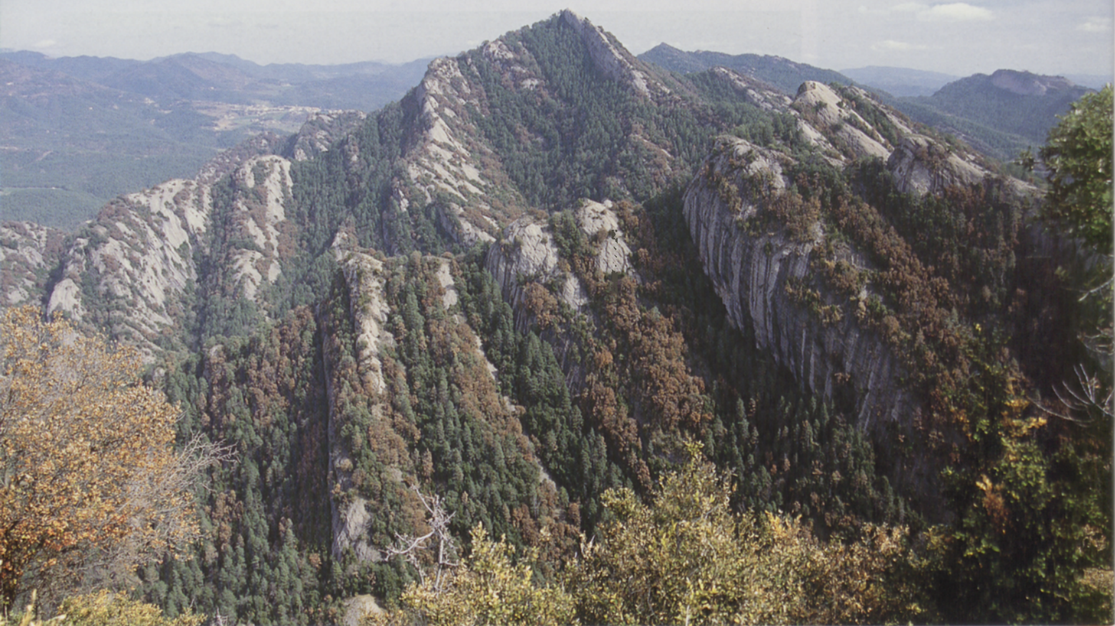
■ Pico de Salga Aguda, cumbre del Picancel

veces son las cumbres secundarias de la sierra las más interesantes, como el Puig de Faig i Branca o el Sobrepuny (1656 m).