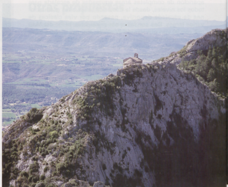
■ Ermita de Sant Pere de Madrona, en la sierra de Queralt