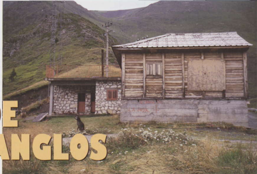
■ Refugio de Llauset

En la cabecera del embalse de Moralets está el Pont de Salenques (1450 m) (16 km Vilaller, 3 km boca sur túnel de Vielha). Iniciando la ascensión conforme indican las marcas de la GR11, se progresa por la margen derecha del Riu de Salenques, prosiguiendo después por el Barranc d'Anglos hasta el Estany Gran, llegando en breve al refugio d'Anglos (2220 m) (2,30 h del Pont de Salenques).