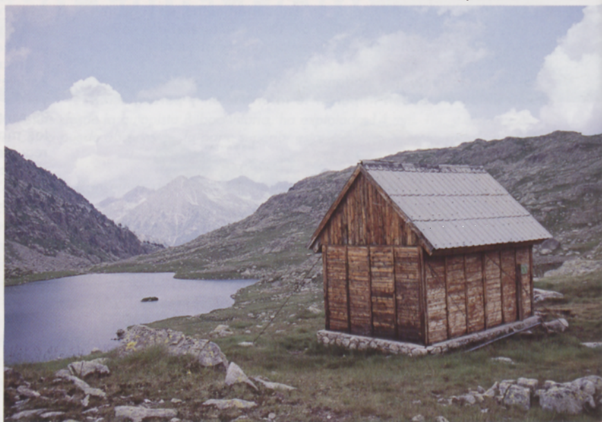
■ Refugio d'Anglos