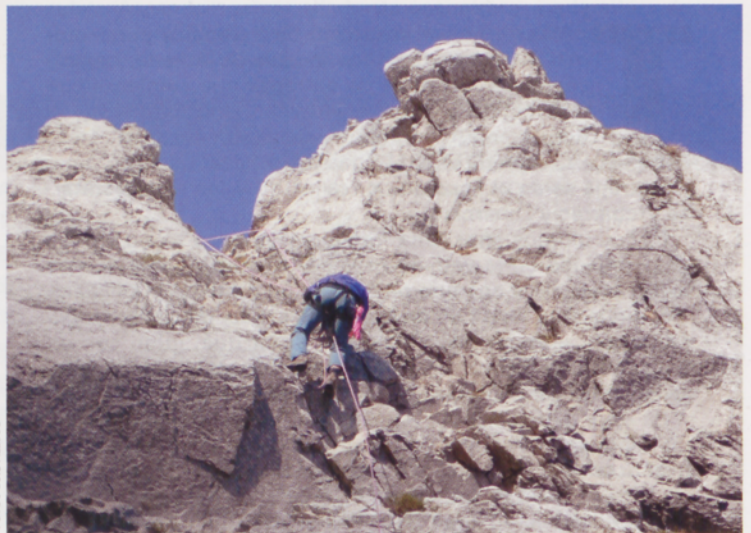
■ Rappel en la torre Frailea

hombro. Aquí se gira a la derecha para acometer los sucesivos resaltes escalonados (III) que impone el espolón que baja de la brecha. Un muro ligeramente extraplomado (III+) nos lleva hacia la izquierda en busca del canalón de hierba (II) por donde se trepa sin dificultades hasta la cumbre (972 m)(AD)(1,45 h).