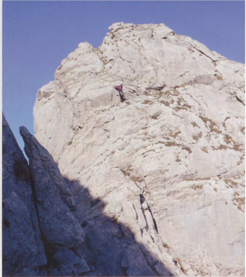
■ Escalando la torre Frailea