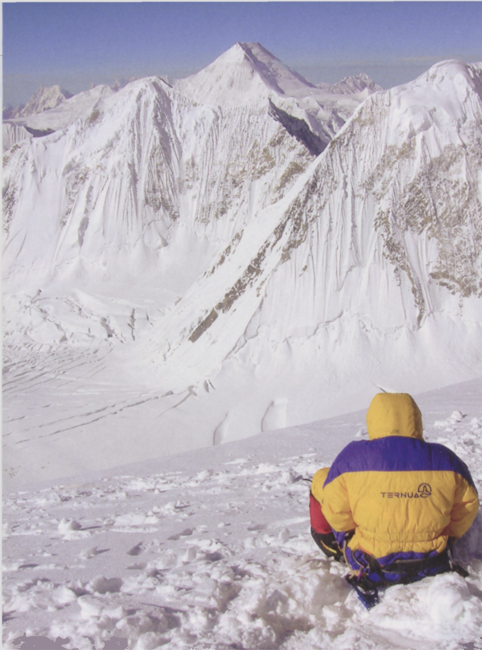
■ Campo 3 del GII. Al fondo el Chogolisa y el GVI

tuen edo zer, baina argi dago ibilbide hori normalean autobusez egiten dela, Karakorum High Way-an zehar. 800 kilometro dira guztira eta bi egun iraun ohi du bidaiak. Bueltan handik etorri ginen. Guri eguraldiak lagundu zigun eta joateko hegazkina hartu ahal izan genuen.