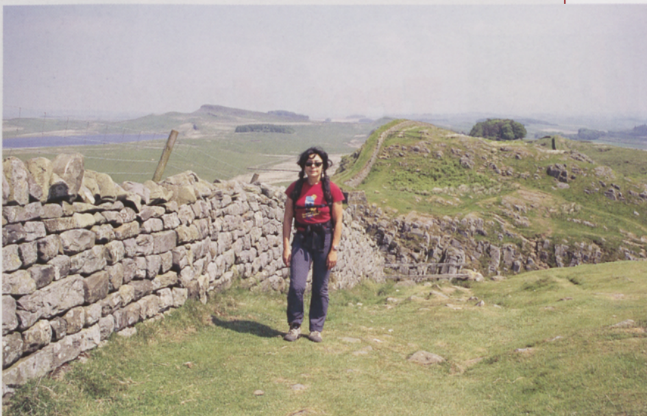
■ Simplemente... el muro