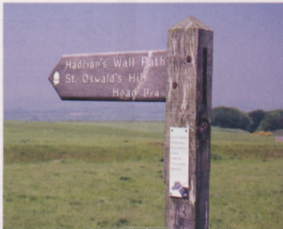
■ Señal indicando la colina de St Oswald's

E n su visita del año 122 a Britannia, el emperador Adriano decide levantar una impresionante frontera para proteger el Imperio de los ataques desde el norte: un muro de piedra de hasta 6 m de altura recorrería la isla de mar a mar, reforzado por guarniciones y fortalezas estables. Hoy, casi 2.000 años después, buena parte de esta faraónica obra se conserva en buen estado y constituye uno de los senderos de largo recorrido más prestigiosos de las islas.