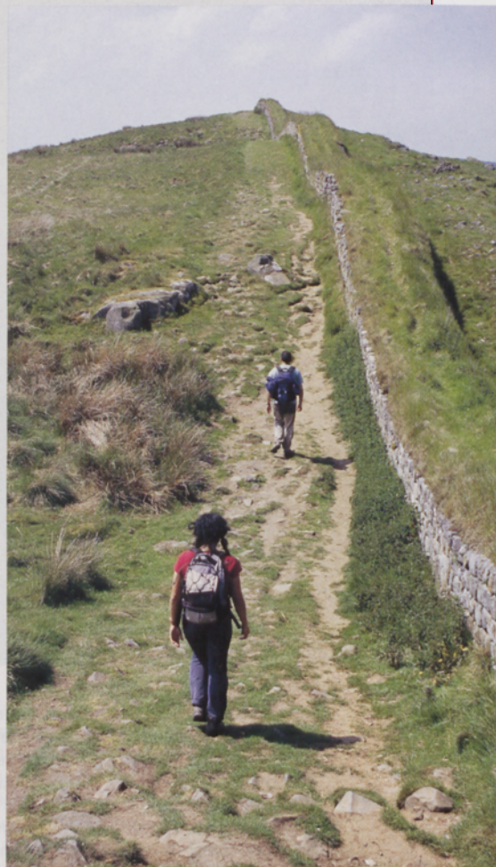
■ Una sucesión de modestas pendientes caracteriza el tramo central del muro

El muro de Adriano fue ocupado durante 300 años hasta finales del siglo IV. A mediados de éste, la presión sobre las fronteras orientales del Imperio Romano demandaba un número cada vez mayor de tropas que hizo que éstas tuvieran que abandonar progresivamente la isla. Las tribus celtas del norte y los scots de la vecina Irlanda superaron la muralla por el norte y el oeste, al tiempo que los sajones provenientes del continente invadirían la actual Gran Bretaña por el este y el sur. Así fue como se produjo la entrada de los actuales escoceses e ingleses en la isla, quedando no obstante ambos lados del muro en el actual territorio de Inglaterra.